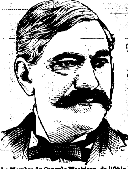
Le Membre du Congrès Meekison, de l'Ohio.

Remarquable Expérience d'un Homme d'Etat Prominent.— Le Membre du Congrès Meekison expose hautement la Peruna.