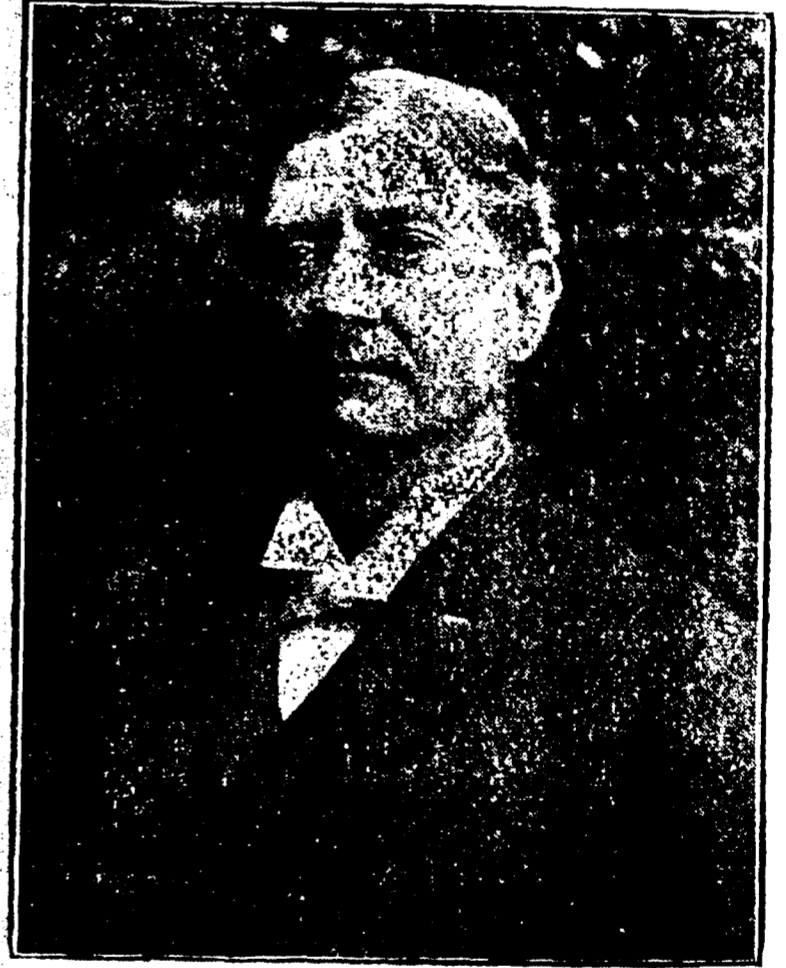
Gouverneur NEWTON C. BLANCHARD qui a prononcé le discours de bienvenue au nom de l'Etat.