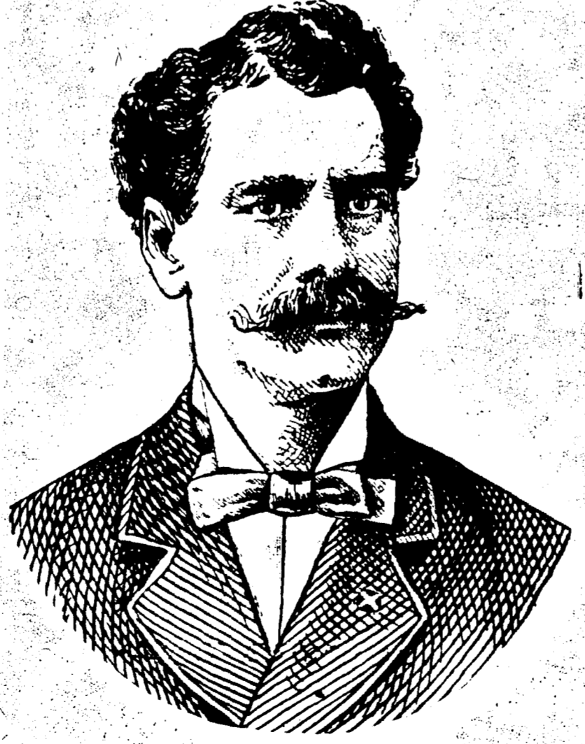
Général ALBERT ESTOPINAL Commandant de la Division de la Louisiane des Vétérans Confédérés.