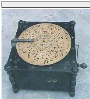
Disco de carton