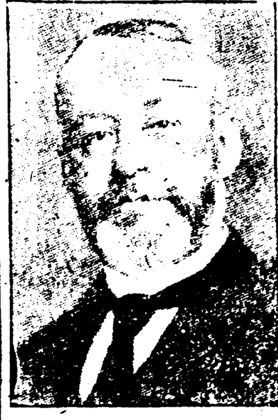
ALCEE FORTIER Président de l'Athénée Louisianais.

DATES DES REUNIONS — Réunions tous les mois à des dates différentes.