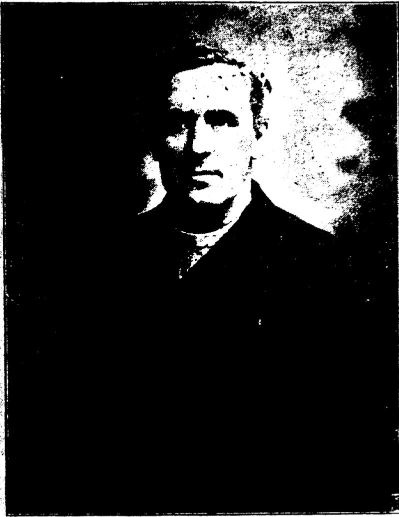
Nouvelles de sa grandeur Monseigneur Laval.

Nos lecteurs seront heureux d'apprendre que Mgr. Laval est attendu à la Nouvelle-Orléans vers le milieu d'octobre.