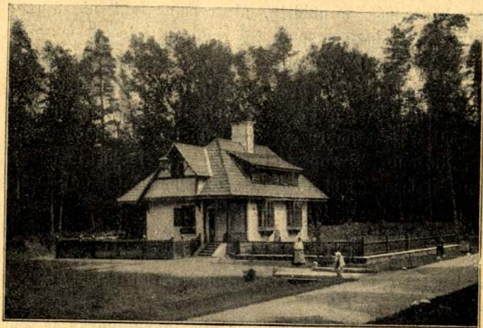
Leśniczówka w puszczy Białowieskiej.