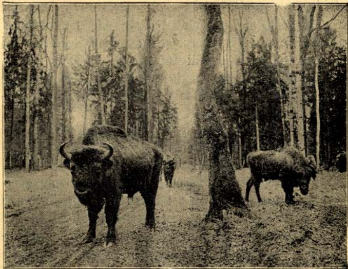
Żubry w puszczy Białowieskiej.