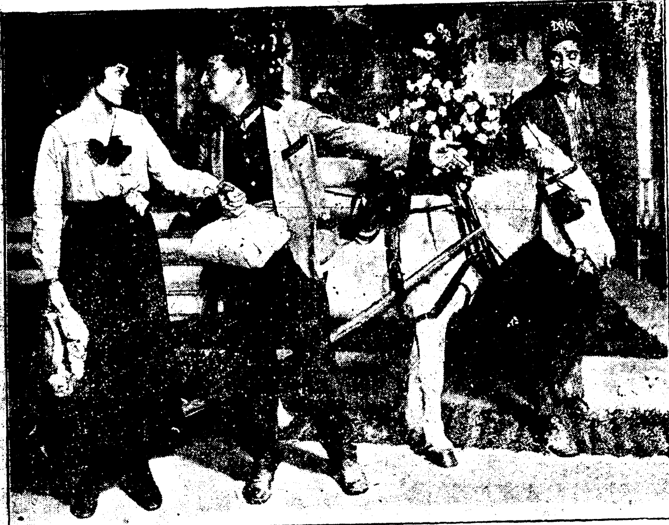
Otis Skinner au Tulane.

"L'ennemi nous a vus, nous sommes repérés. Aussitôt les Heaons blancs, verts, noirs de ses obus viennent s'élever au-dessus et au-dessous de nous. Nous sommes bien encadrés... à chaque obus, le déplacement d'air fait faire d'énormes bonds à notre appareil — on