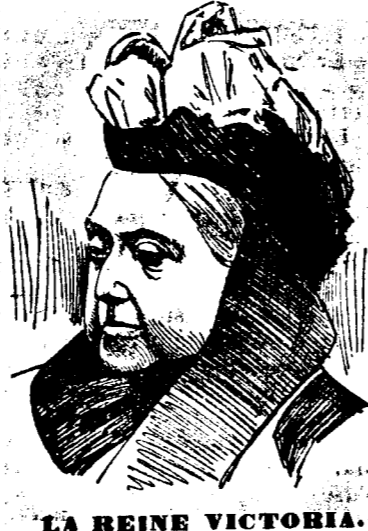
LA REINE VICTORIA.