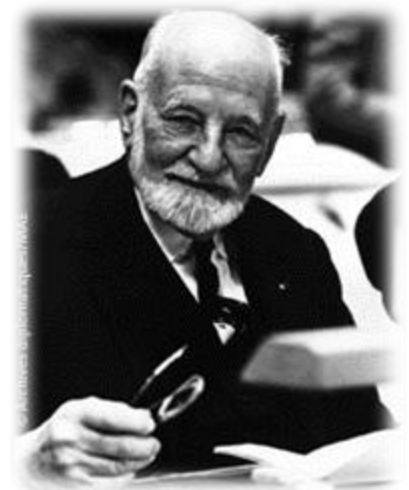
René Cassin: autor de la declaración de los derechos humanos universales

Los derechos humanos, llamados también derechos fundamentales o derechos del hombre, disponen de una simiente con una raíz filosófica, histórica, política y así mismo tienen una expresión normativa de acuerdo con las condiciones de cada país, región, provincia o entidad federativa. Ellos representan y son el compendio de los más altos valores de la humanidad, porque resumen las nobles aspiraciones del ser humano por vivir con libertad, igualdad, fraternidad, paz, dignidad, democracia, justicia y solidaridad. En la genealogía de los derechos humanos encontramos antecedentes que se convirtieron en la piedra 251 de toque de las diversas declaraciones, estatutos y legislaciones a partir del siglo XVIII. Dichos precedentes son remotos y tienen un carácter metajurídico, por ejemplo el código mosaico, el código de Hammurabi, las leyes de Solón.