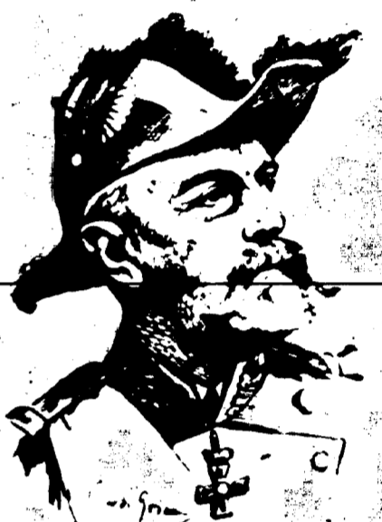
Le roi Oscar de Suède est mourant.