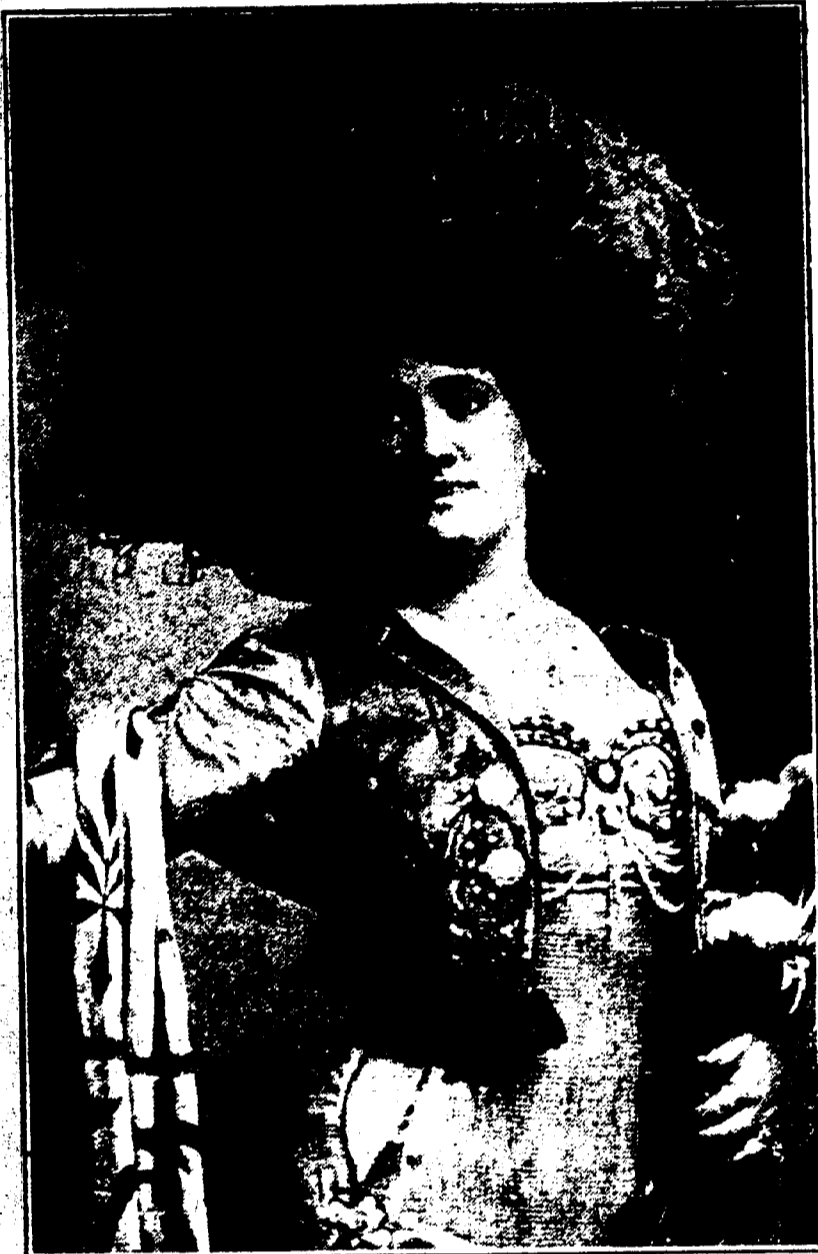
MLLE LAVARENNE — SOPRANO