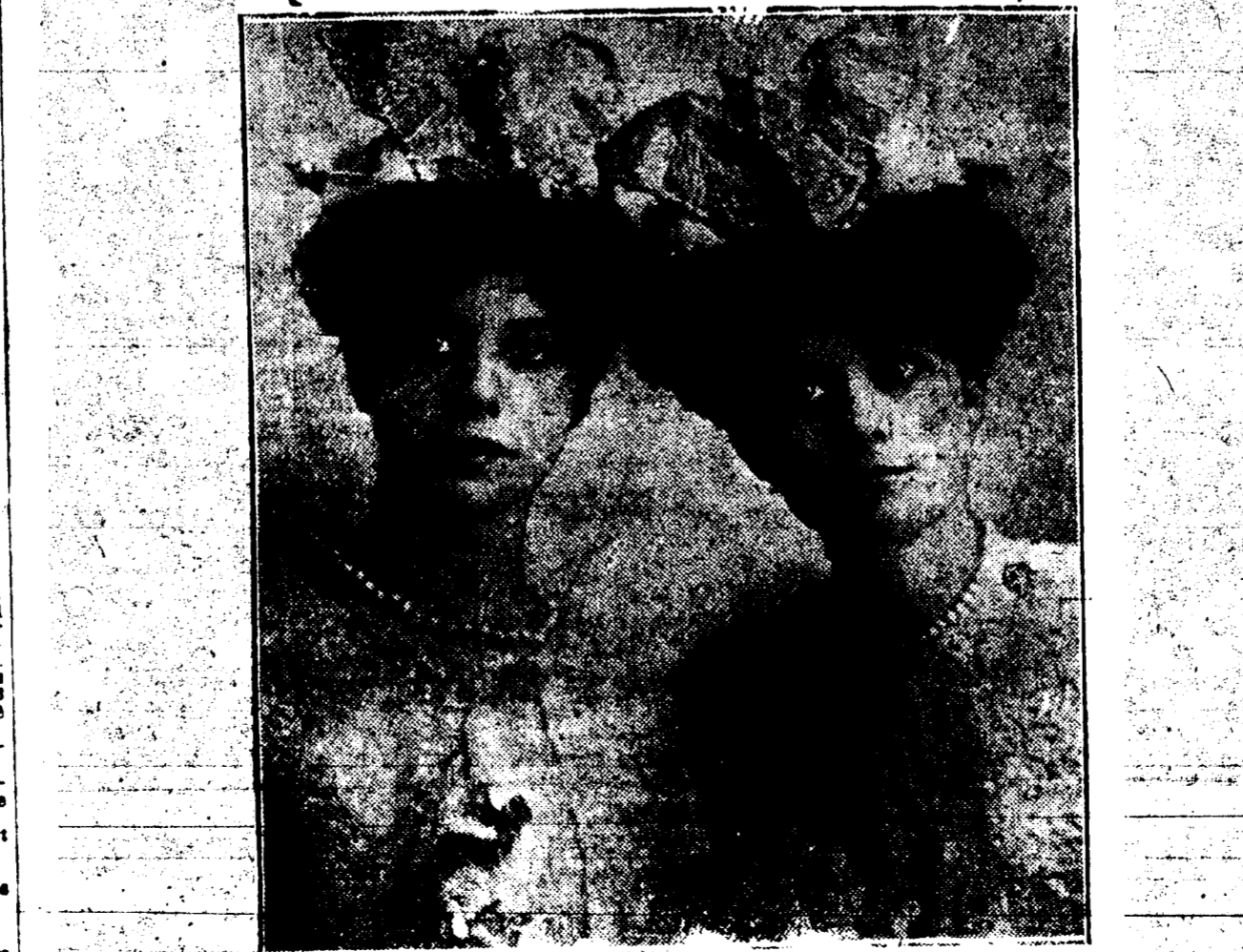
Misses Dagwell à l'Orpheum