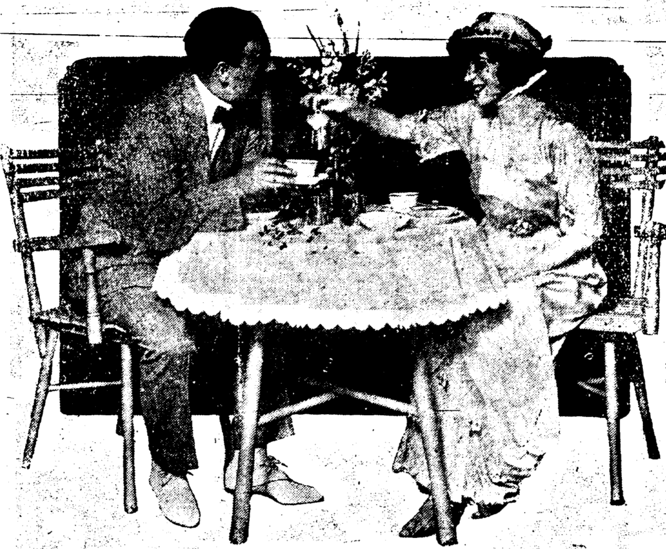
Scène tirée d'Adèle, au théâtre Tulane.

St. Charles Hotel Co. vs. T. P. Lear. COUR CIVILE DE DISTRICT pour la Paroisse d'Orléans - No. 107,006 - En vertu d'un writ de fieri facias qui m'a été adressé par l'honorable Cour Civile de District pour la Paroisse d'Orléans, dans l'affaire et-dessus intitulée, je procéderai à vendre à l'encan, dans le local ci-dessus désigné le LUNDI 23 Mars, 1914, à 10 h. 30 a. m., la propriété suivante décrite à savoir: Dans le bureau au No. 718 rue Commune, Hotel St. Charles. Un lot de meubles de bureau, accessoires, divers, etc., suivant l'inventaire enregistré. Une machine à écrire, un coffre fort en fer. Saleté dans l'affaire et-dessus. CONDITIONS. - Comptant sur les lieux. LOUIS KNOP, Sheriff Civil, Paroisse d'Orléans. DENMORE, LEVY & CHAFFE, avocats pour la demanderesse. mars 10-17-23