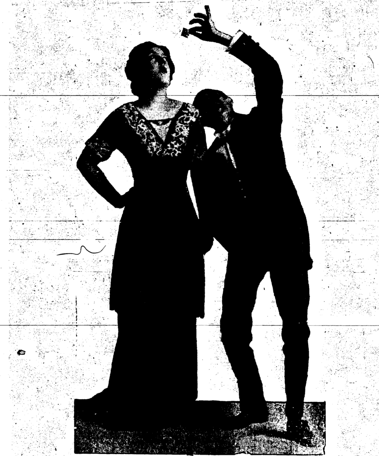
"A MODERN EVE", Au Crescent