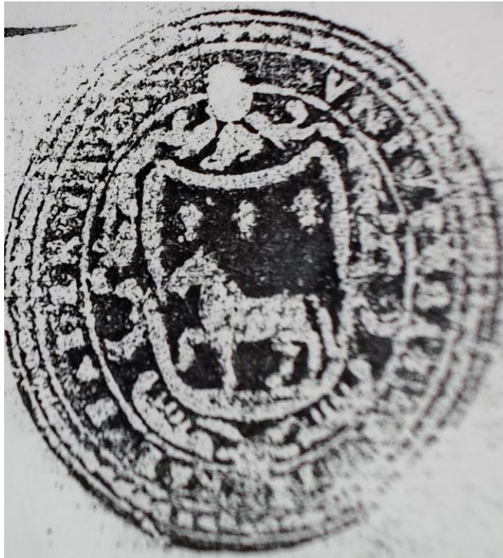
Figura 1: Antico stemma di Falerna, estratto da una supplica del 1762, indirizzata al.