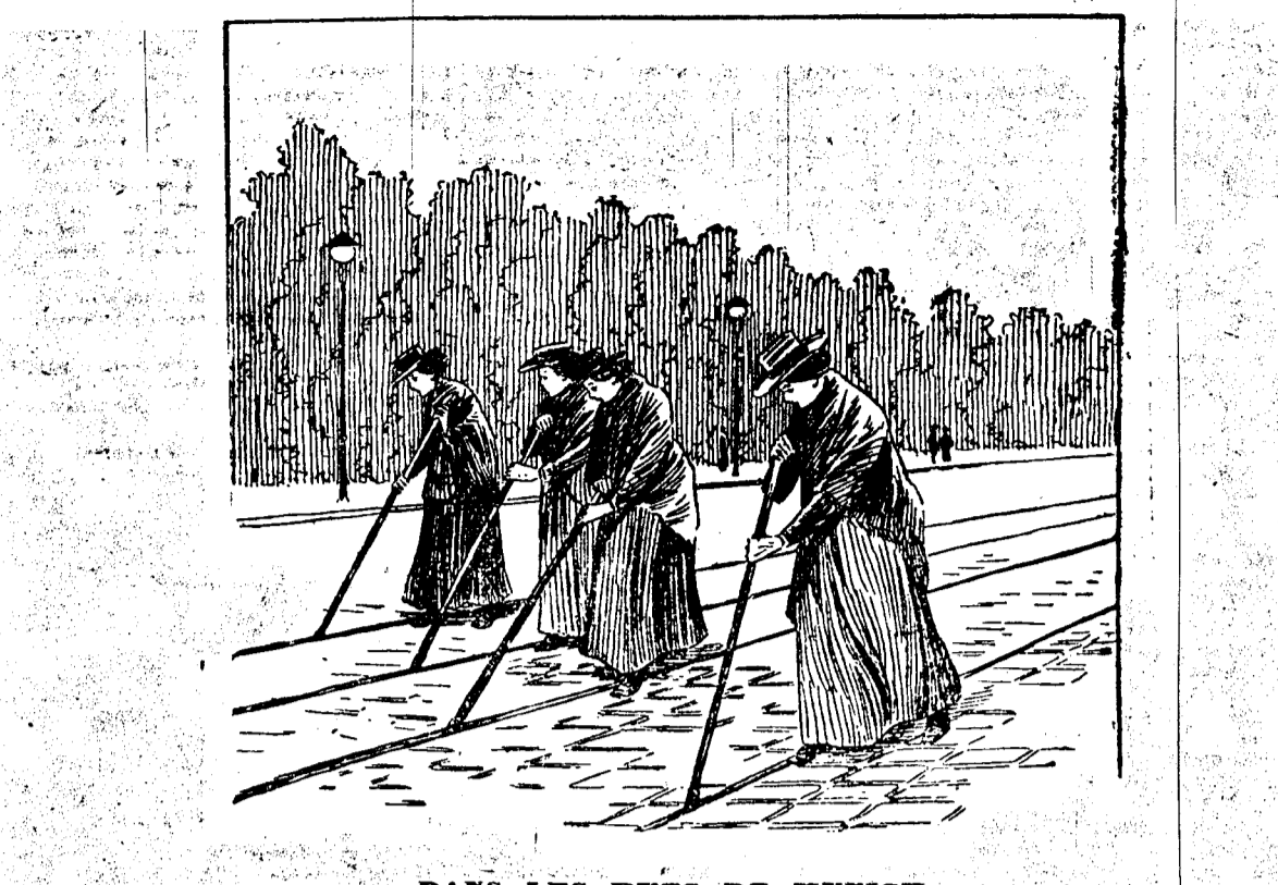
DANS LES RUES DE MUNICH.

Le programme du voyage de l'Empereur et de l'Impératrice d'Allemagne en Orient vient d'être définitivement réglé, ainsi que les réceptions qui leur seront faites dans les différentes villes qu'ils ont l'intention de visiter.