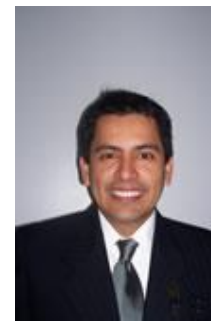
MV Fernando Chávez Zapata