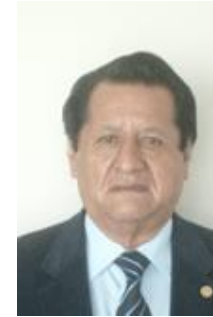
Colegio de Licenciados en Administración