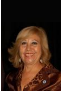
Colegio de Enfermeras(os) del Perú