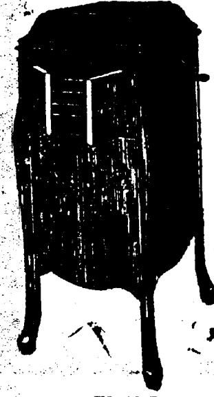
Victrola XI, 12 Records. Prix $109. Conditions—Un quart comptant, le solde en six paiements mensuels égaux.