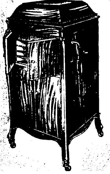
Victrola XVI, 12 Records. Prix $209. Conditions—Un quart comptant, le solde en six paiements mensuels égaux.