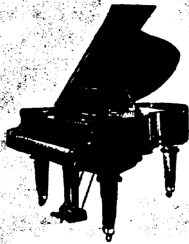
5 pieds Grand, $675 comptant. 5 pieds 7 pouces Grand, $725 comptant. 6 pieds 5 pouces Grand, $800 comptant. Conditions—$25 par mois, 6 pour cent arajout.