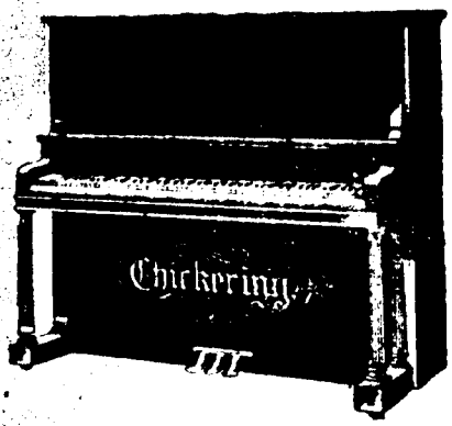
4 pieds 2 pouces droit, $500 comptant. Conditions—$12 par mois, 6 pour cent arajout. 4 pieds 6 pouces droit, $550 comptant. Conditions—$12.50 par mois, 6 pour cent arajout.