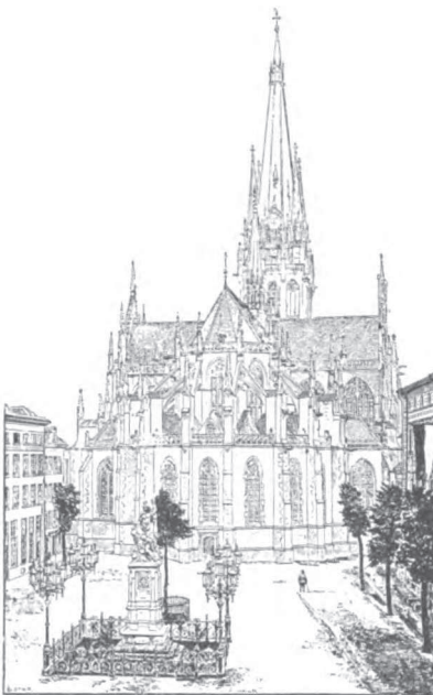
De gerestaureerde Willebrorduskerk te Wezel.

Waarlijk, 't zou zaak zijn in 's werelds gedrang wat ruimte te maken voor meer verzachting van zeden!