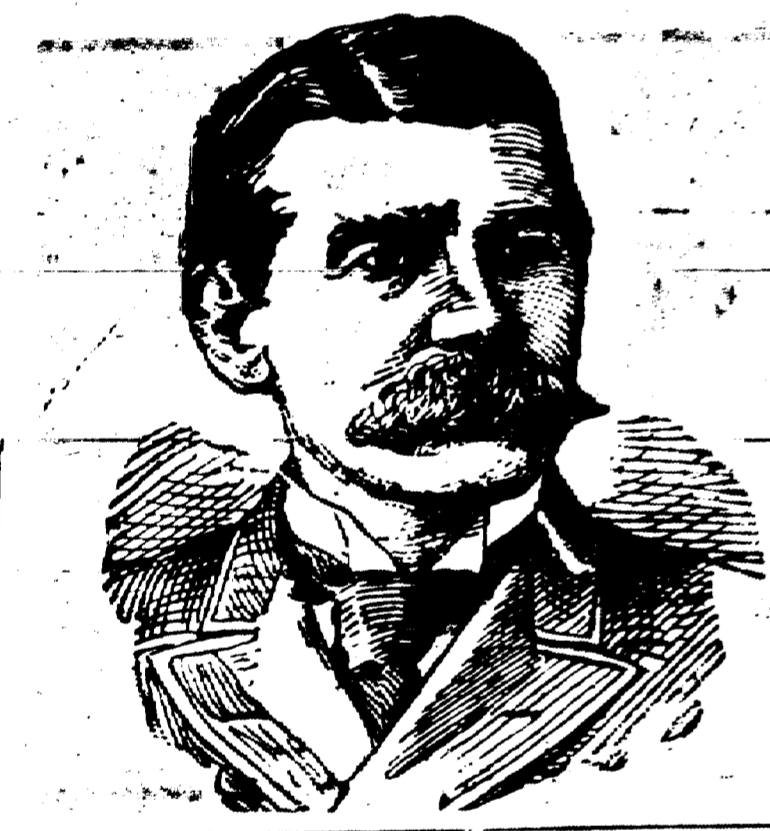
Général HORACE PORTER. Ambassadeur des Etats Unis en France.