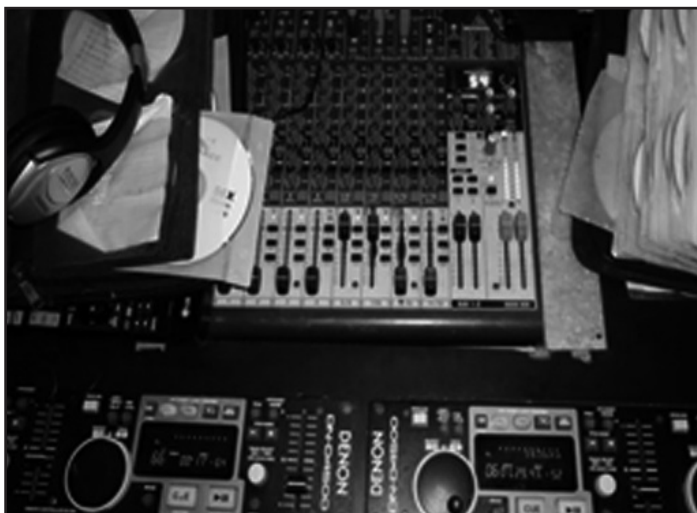
FOTO 9. CONSOLA EN EL PICK-UP TRADICIONAL