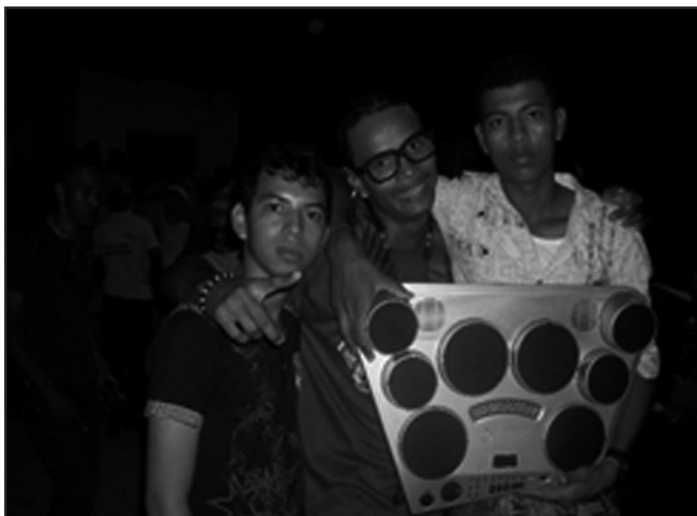
FOTO 8. BATERÍA EN EL PICK-UP TRADICIONAL