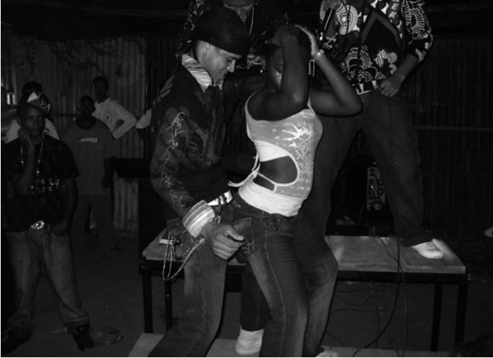
FOTO 4. EL CHOQUE O GOLPEADITO

El CHOQUE: En este pase, el punto de concentración de movimiento es la zona pélvica trasera y delantera de la pareja, más específicamente el choque se da entre los genitales. El movimiento es sensual y cargado de pasión y devela la forma de estimulación entre una pareja.