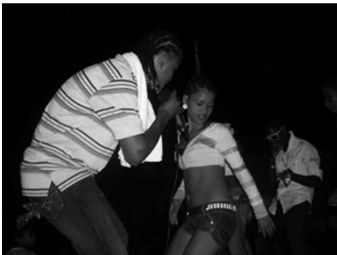
FOTO 6. EL PERREO

En términos generales y a manera de conclusión cabe anotar que el baile de la champeta esta tejido por balanceos, brinco, subidas y bajadas en abrazos cuerpo a cuerpo de la pareja. Zarandeos, contoneos, desplazamientos casi horizontales de los bailarines, que resumen una danza de una gran estética visual y manifestación de un lenguaje no verbal manifestados en los movimientos del cuerpo que expresan sentimientos y emociones, además de deleite y placer ; logrando contagiar al espectador y dando paso al fomento cultural mediante la práctica del baile de este género.