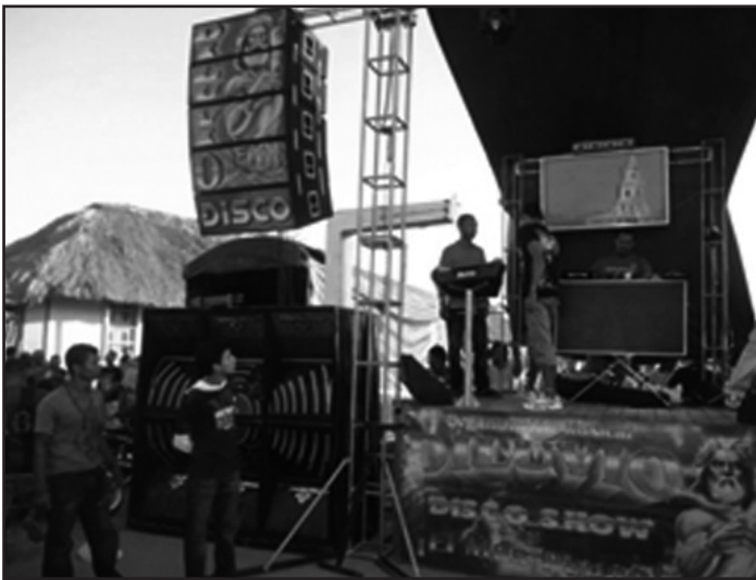
FOTO 10. PICK-UP TRADICIONAL

Inicialmente, cabe anotar que el género de la champeta a permitido el surgimiento de elementos como el pick-up. Lo cual corresponde a (una criollización de la palabra “pick-up”, expresión con la que se designa en inglés el brazo del tocadiscos). En primer lugar, está el tipo de música que amplifican. Si bien el fenómeno de los Sound Systems es compartido por varias comunidades afro descendientes, los géneros musicales que reproducen varían según el lugar geográfico. Mientras que en Jamaica los Sound Systems están asociados al ska, el dub y el rocksteady; y en el Reino Unido con el rap y al hip-hop, los pick-up colombianos realmente no están ligados a un género musical específico sino que funcionan más bien como plataformas para el género bailable de moda. De acuerdo con algunos datos históricos los pick-up, las familias de los barrios