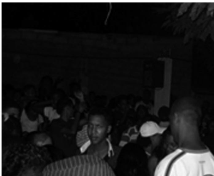
FOTO 13. BAILE EN CASETA

LA CASETA: El término caseta se refiere a la construcción provisional y desmontable que se destina a la realización de espectáculos, principalmente en fiestas populares. Por lo general, son construidas en espacios abiertos y el material que se utiliza para su elaboración está compuesto de laminas de zinc. En las zonas costaneras de Colombia, las casetas se han convertido en una marca de identidad para los estratos bajos y su referente es un lote vacío cercado con laminas, en cierta medida la caseta es la plataforma para los bailes populares y consta de una taquilla o entrada principal para el pago del ingreso al lugar.