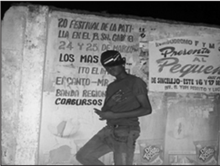
FOTO 12. CARTELES PUBLICITARIOS