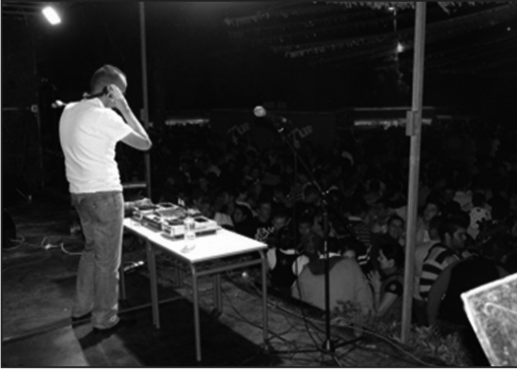
FOTO 11. DJ. ANIMANDO LA CASETA

una figura de la farándula popular. Rodeado por el juego de luces que irradian en el lugar con sus colores, su montaje y la potencia que literalmente estremece con la frecuencia de la onda sonora impulsando los movimientos los cuerpos. Pero una vez asimilada la parte física del espectáculo, en los pick-up de champeta existen también los Djs segundos y los percusionistas, llamados también bateristas, pianistas o tecladistas, que cumplen la función de hacer una serie de efectos de sonido sobre las canciones. Se les llama tecladista porque su primer instrumento para lograr los efectos fue un teclado electrónico pequeño. En nuestros días los “pianistas” se les comenzó a llamar bateristas porque los teclados han sido reemplazados o acompañados por percusiones eléctricas. A estos efectos de sonido hechos en vivo se les llama perreo. La función del perreo es acentuar la percusión y llevar la cadencia del baile durante toda la canción, especialmente y cobrando protagonismo durante el “espeluque” que es el “clímax”