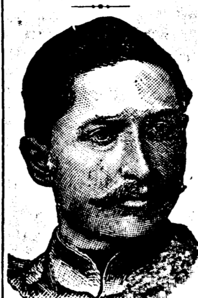
Un discours de l'empereur d'Allemagne.

Madrid, Espagne, 20 juin.—Senor Sagasta, premier ministre, questionné aujourd'hui, a dit que malgré les rapports américains rien n'était décidé au sujet de l'échange du constructeur naval Hobson et de ses compagnons pris par les espagnols après avoir coulé le Merrimac dans le chenal étroit conduisant au port de Santiago de Cuba.