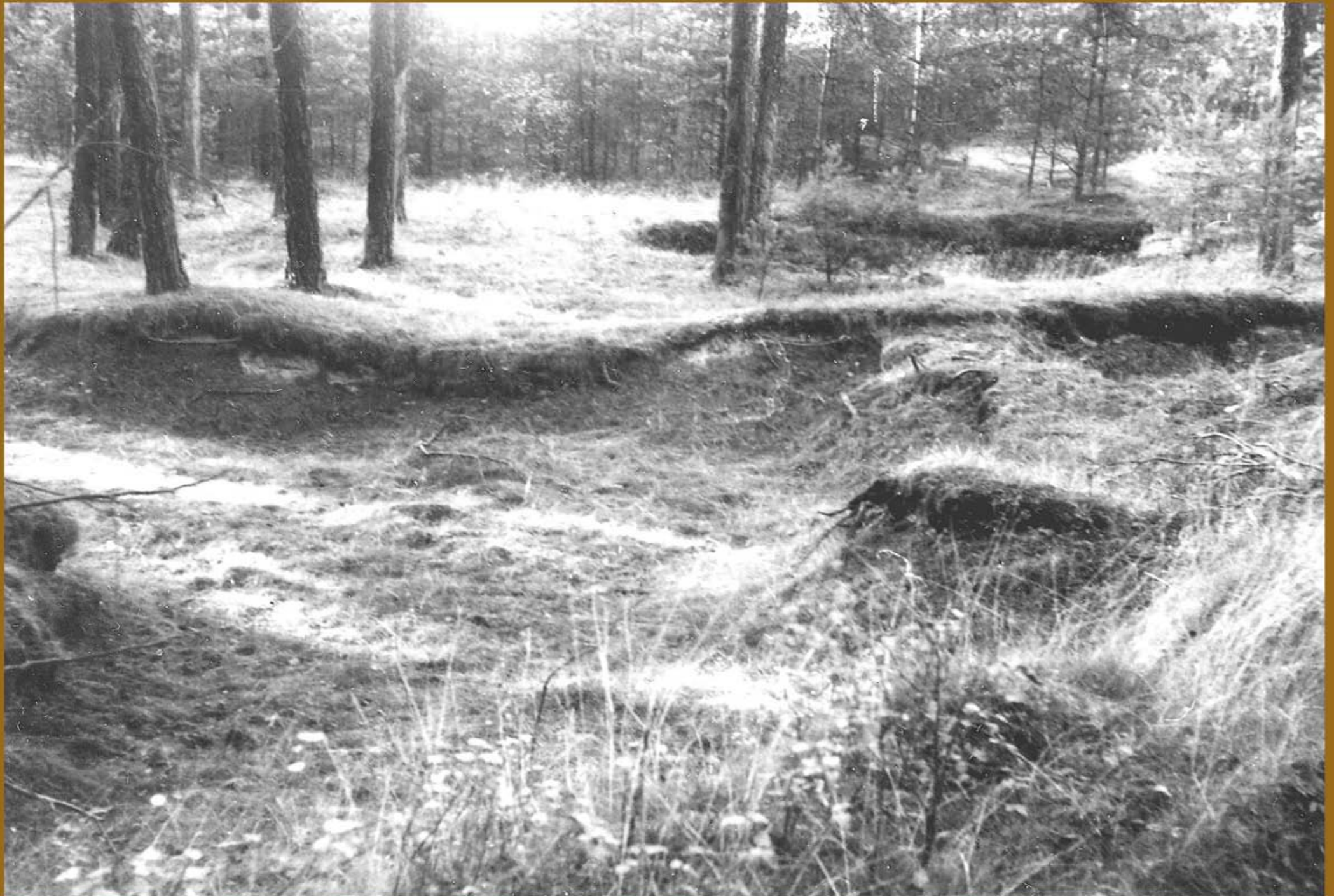
Foto : G. Pinzke , 1977 . Tagesoberfläche unweit des Eingangs zu Conow-Stollen IV