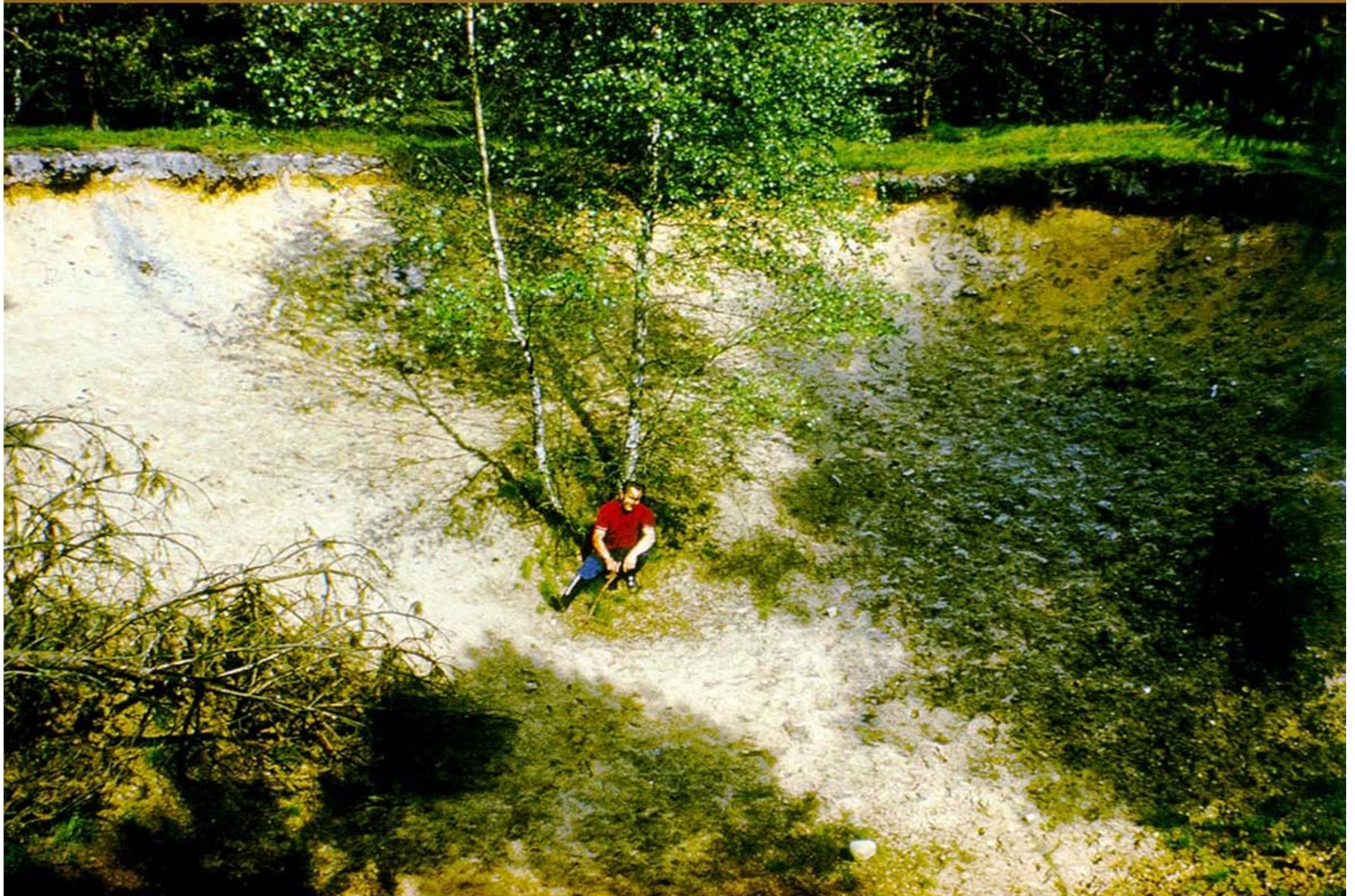
Foto : G. Pinzke , 1979 . Tagesbruch über Grubenbauen des Conow-Stollens IV