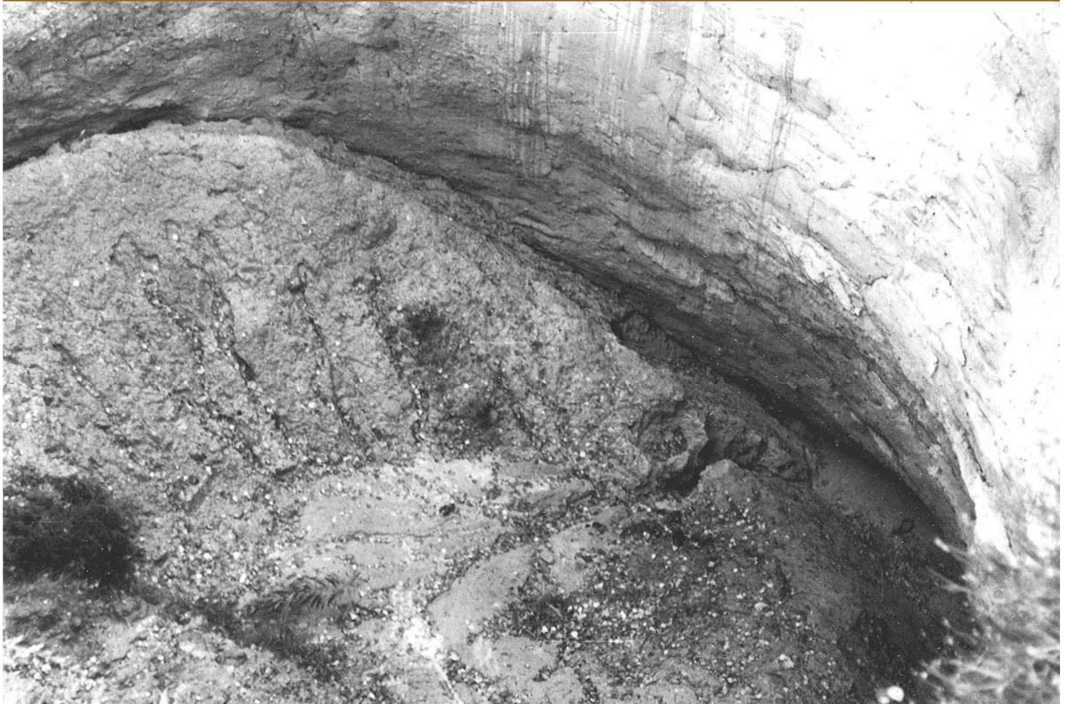
Foto : G. Pinzke , 1978 . Frischer Tagesbruch über Grubenbauen des Conow-Stollens V