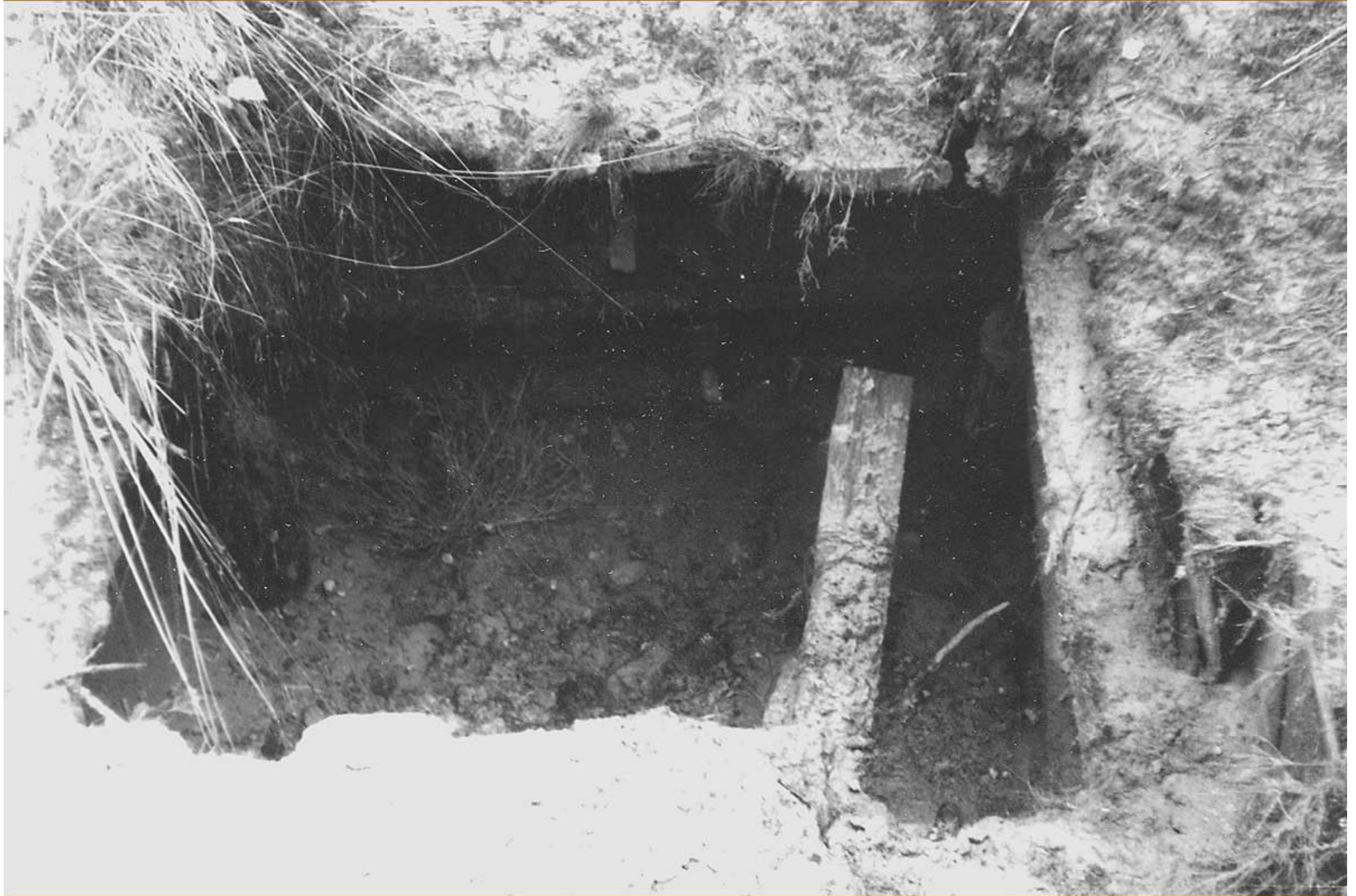
Foto : G. Pinzke , 1977 . Verstürzter Wetterschacht bei Conow-Stollen V