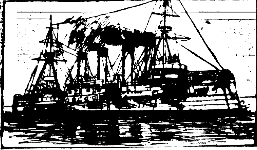
Le croiseur "Bayan" qui s'est échoué dans la rade de Port Arthur.