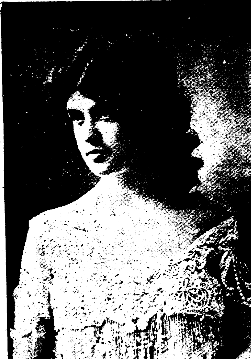
MARGUERITE CLARK, Dans "Wang", au Shubert.