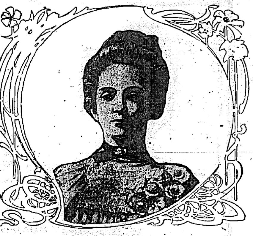
Mlle ALICE ROOSEVELT, marraine du nouveau yacht de l'empereur d'Allemagne.