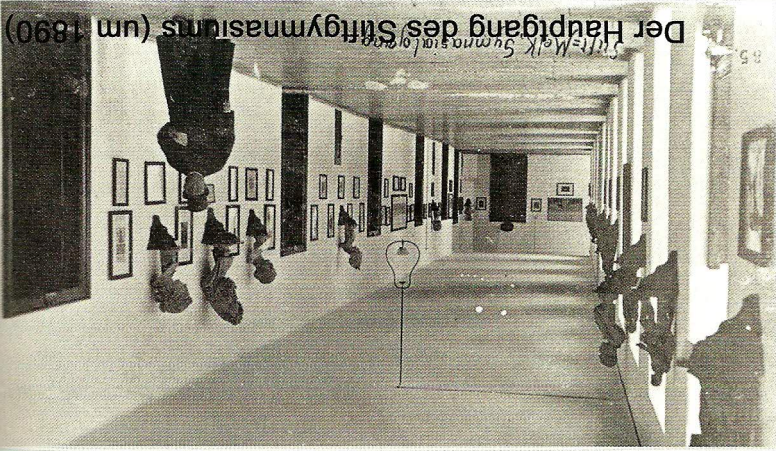
Der Hauptgang des Stiftsgymnasiums (um 1890)