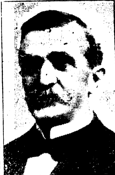
EMILE S. ECUYER Président de l'Union Française.

DATES DES REUNIONS — Réunions le premier jeudi de chaque mois.