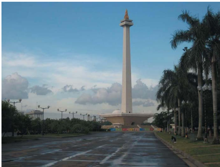
印尼独立纪念碑广场

【政府】实行总统制，总统既是国家元首，也是政府首脑，同时掌管三军。总统、副总统均由全民直选产生，任期5年，总统可连任一次。现任总统苏希洛·班邦·尤多约诺，2009年10月通过直选连续第二届担任总统，副总统为布迪约诺，任期至2014年。本届政府共有内阁成员38名。