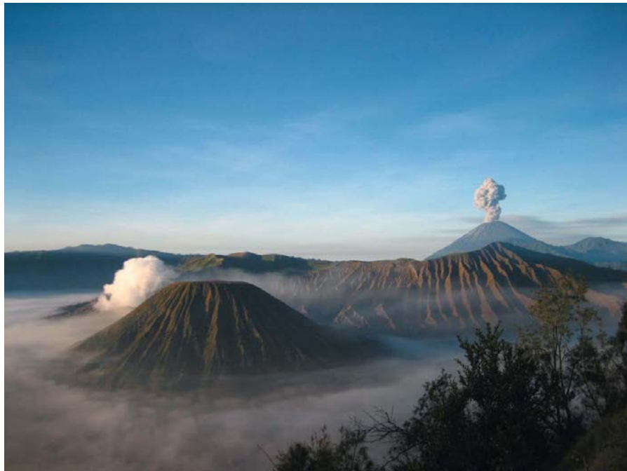
印尼著名的活火山—BROMO火山

印尼自然资源丰富，有“热带宝岛”之称。盛产棕榈油、橡胶等农林产品，其中棕榈油产量居世界第一，天然橡胶产量居世界第二。主要矿产资源有石油、天然气、锡、铝、镍、铁、铜、锡、金、银、煤等，储量均非常丰富。