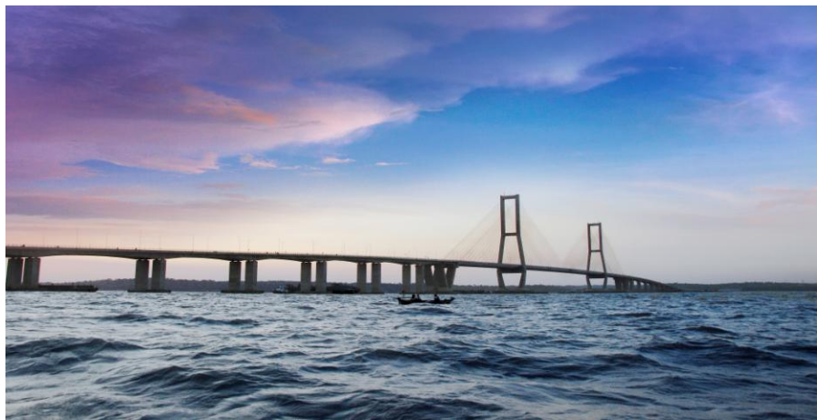
中国企业在印尼建成的承包工程项目——泗马大桥

【对印尼投资】据中国商务部统计，截至2009年末，中国对印尼直接投资累计达到7.99亿美元，其中2009年当年直接投资流量2.26亿美元。