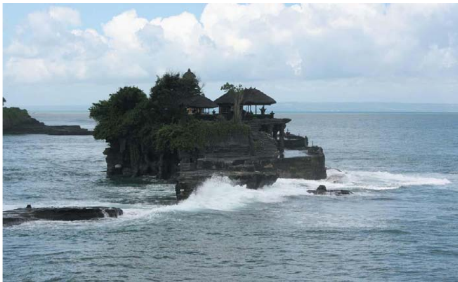
巴厘岛著名景点——海神庙

【同马来西亚的关系】1957年与马来西亚联邦建交，1963年9月马来西亚成立后两国断交，1967年两国复交。2007年2月，马总理巴达维对印尼进行工作访问。5月，马最高元首阿比丁访问印尼。8月，印尼副总统卡拉参加马独立50周年纪念活动。2008年1月和2010年5月，印尼总统苏希洛访马。