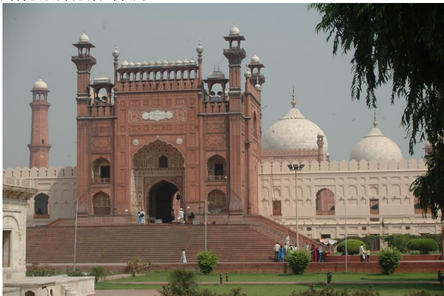
拉合尔市巴德夏希清真寺

伊斯兰教徒特别注意男女有别，在公共场所青年男女互不来往，所以在见到有女士时，男士一般不主动握手，女士主动伸手时，男士才与其握手；一般见面时可握手，亲密的朋友间也可拥抱；在巴基斯坦，严禁男女当众拥抱或接吻，并认为当众接吻是一种罪恶，须罚款并坐牢一周；女子上街时，严禁穿着过透、过露的服饰，禁忌别人为女子或与女子拍照，否则将被视为犯有淫荡罪。