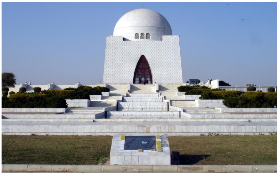
巴基斯坦国父贞纳之墓

【军队】军队在巴基斯坦政治生活中扮演着极为重要的角色，尤其是出现政治危机时，军队更成为一支决定国家前途和命运的重要力量。建国以来，由于巴基斯坦民主政治制度不完善，政局长期动荡，1958-2001年，巴基斯坦陆军4位首领阿尤布·汗将军、叶海亚·汗将军、齐亚·哈克将军和穆沙拉夫将军先后接管国家政权，实行“军法统治”长达24年。即使在民选政府执政期间，军队也积极参与国家大政方针的制定。