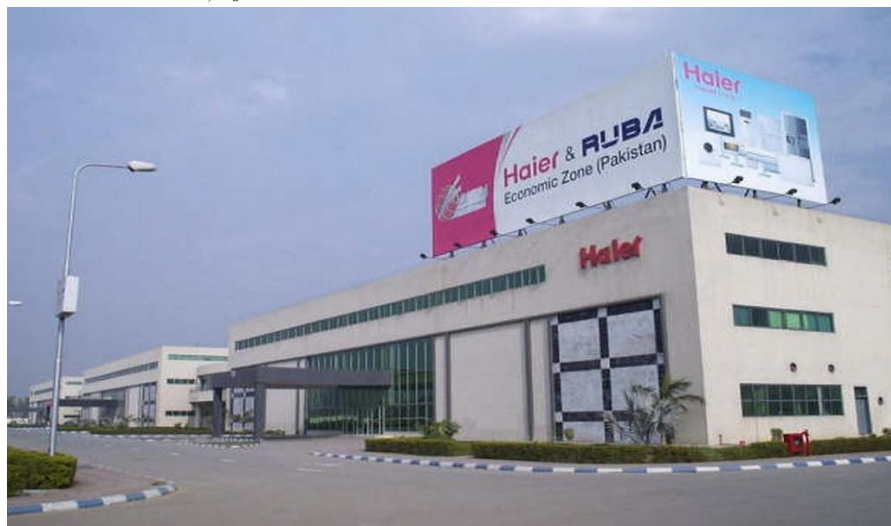
海尔鲁巴经济区厂区

【经贸合作区】由胡锦涛主席亲自挂牌成立的海尔—鲁巴经济区为中国企业在巴投资兴业提供了新的平台。该区位于巴基斯坦第二大城市拉合尔，是中国商务部批准建设的首批“中国境外经济贸易合作区”之一，也是巴政府批准建设的“巴基斯坦中国经济特区”，是中巴五年规划的重点项目之一。该区重点发展的产业为纺织与织机、汽车摩托车及配件、建材业、农业和畜牧业、小家电及发电设备、化工及包装印刷业等。（详情可参阅 hrsez.haier.com ，投资热线：0532-88938290/8213，传真：0532-88938029）。