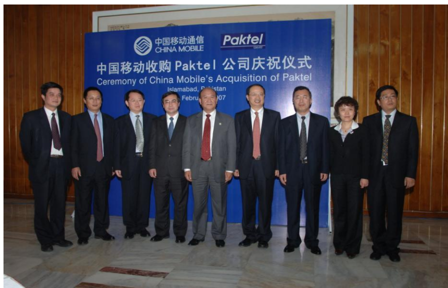
电信运营商“走出去”的重大尝试——中国移动收购巴基斯坦移动公司

在建的重要项目有：尼勒姆杰勒姆水电站项目（葛洲坝集团）、恰希玛核电站二期（中原工程）、喀喇昆仑公路升级改造项目（中国路桥）、人马座七星级酒店项目（中建）、君悦酒店项目（中建）、真纳水电站（东方电气）、南迪普联合循环电站（东方电气）等。