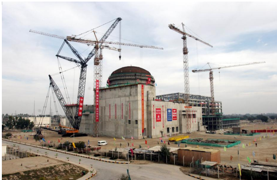
中国在巴最大承包项目——已投入运营的恰希玛核电站一期和在建的二期

【对巴援助】巴基斯坦是中国重要的援助对象国。自1956年以来，中国向巴基斯坦提供了力所能及的经济技术援助，主要包括无偿援助、无息贷款和优惠贷款。重大援助项目包括：喀喇昆仑公路、塔克西拉重型机械厂、真纳体育场、瓜达尔港、中巴友谊中心（在建）等。