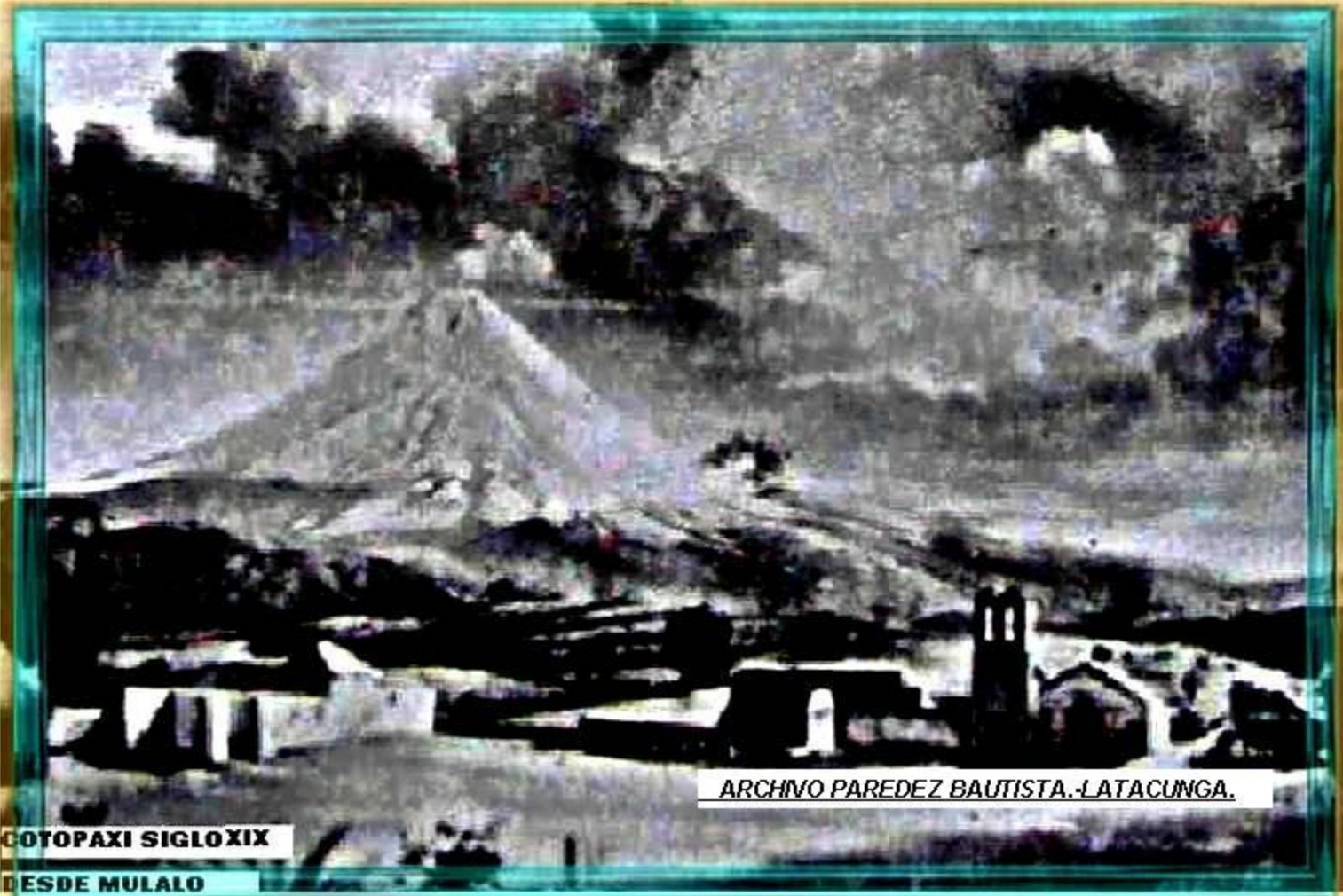
ARCHIVO PAREDEZ BAUTISTA.-LATACUNGA.