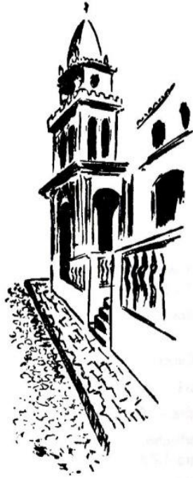
Torreón de la Catedral, desde la calle Quito.