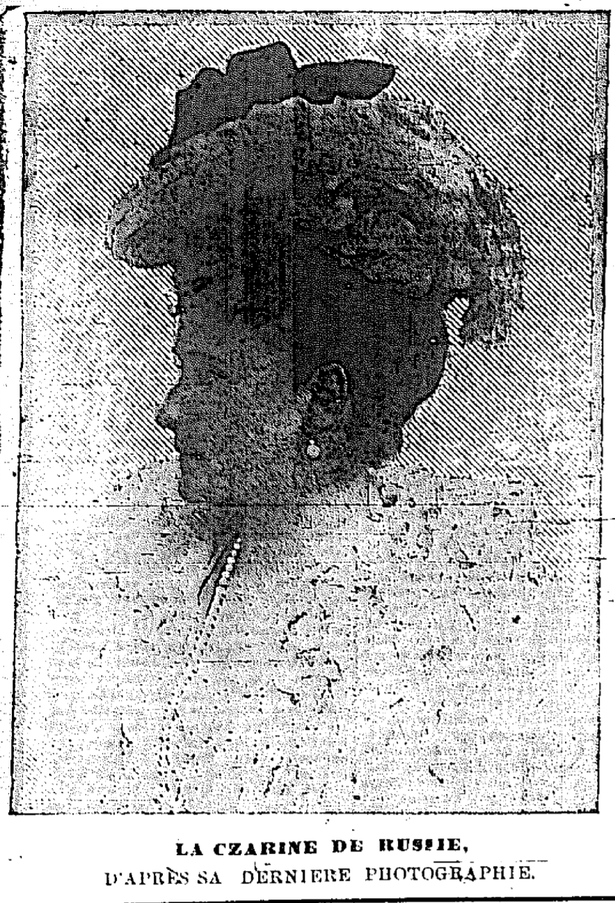
LA CZARINE DE RUSSIE, D'APRES SA DERNIERE PHOTOGRAPHIE.