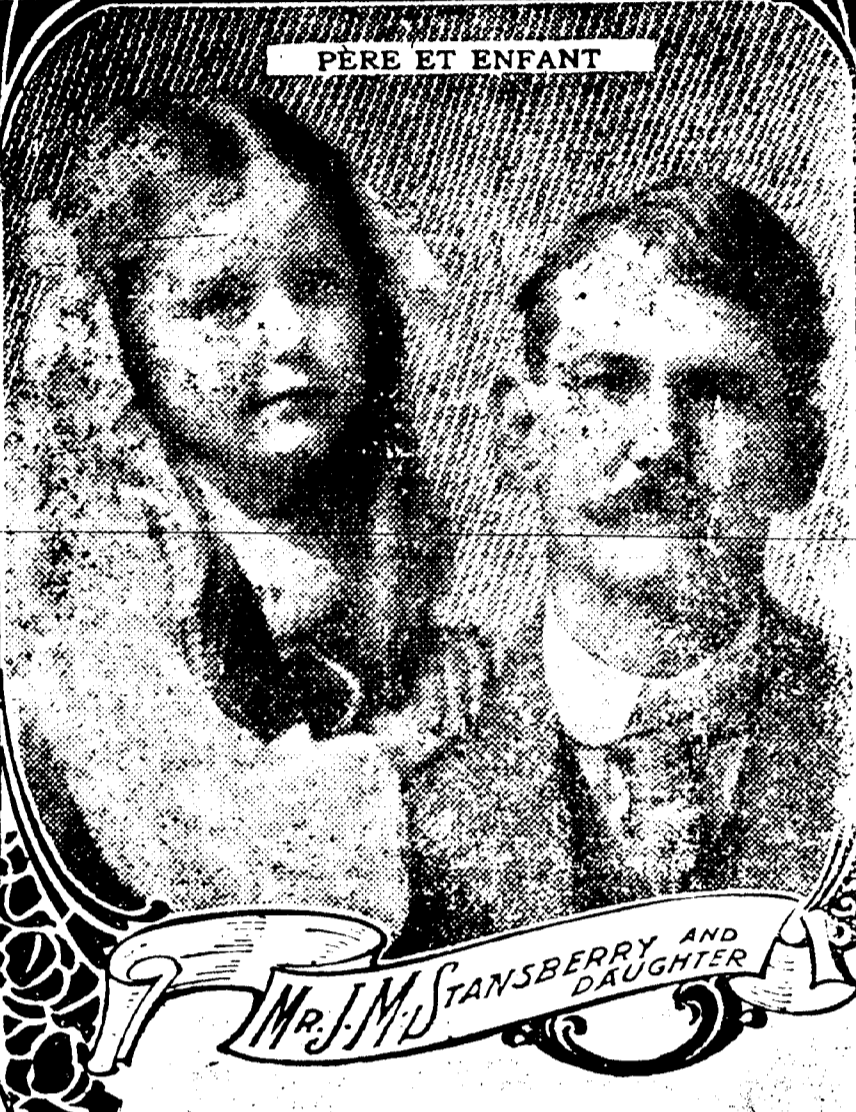
PERE ET ENFANT