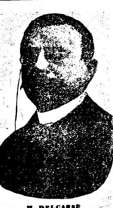
M. DELCASSÉ. Ministre des Affaires Etrangères.