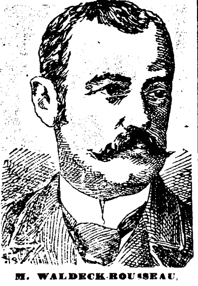
M. WALDECK-ROUSSEAU. Président du Conseil et Ministre de l'Intérieur