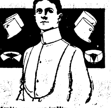
1er dé - m - mar, Joe'dim

Telephone Cumberland et People 316. BUREAU: No 816 RUE DU CAMP. BUANDERIE: 530-532 RUE JULIE.