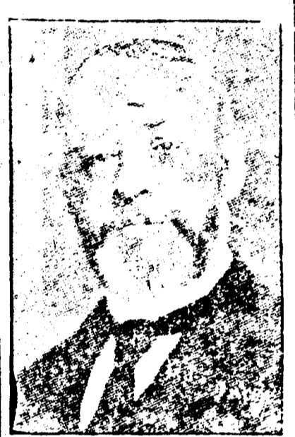
ALCEE FORTIER, Président de l'Athénée Louisianais.

DATES DES RÉUNIONS — Réunions tous les mois à des dates différentes.