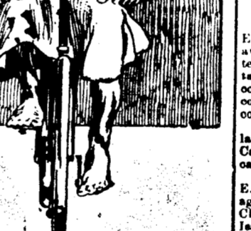
Les Premiers Bicyclistes.