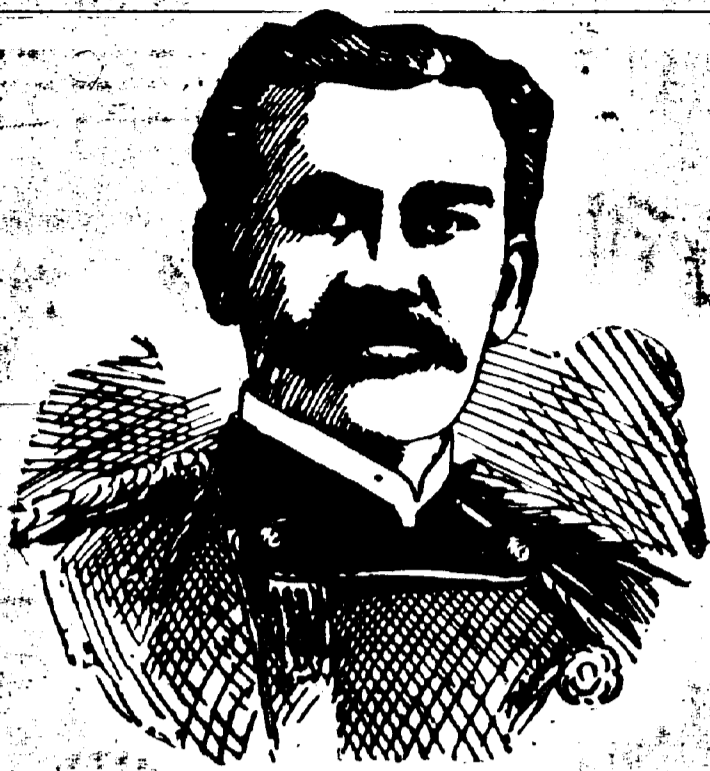
Le général ADNA R. CHAFFEE, promu au grade de major général des volontaires des Etats-Unis.