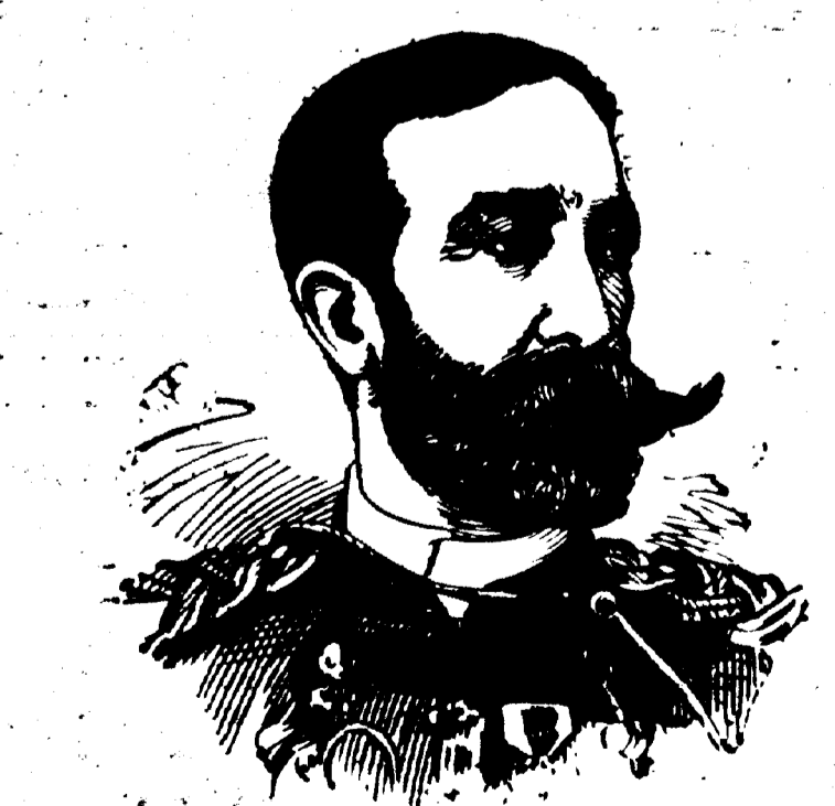
Le général LLOYD WHEATON, promu au grade de major général des volontaires des Etats-Unis.