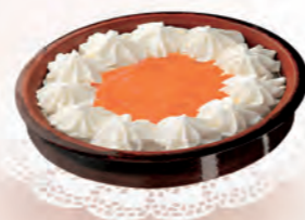
Tarrina al Whisky