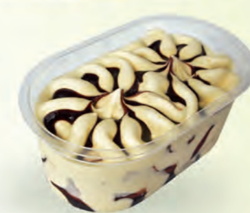
Vainilla con salsa de chocolate