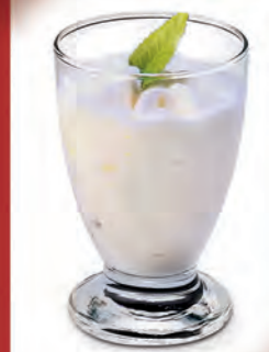
Helado de Limón