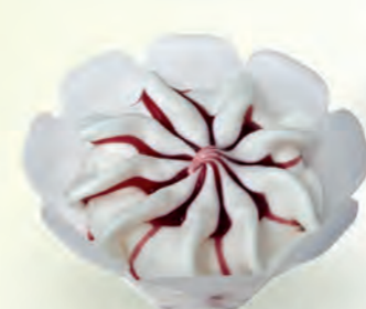
Yogur con Frutos del Bosque