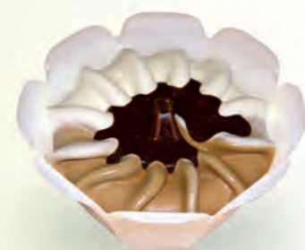
Nata · Café