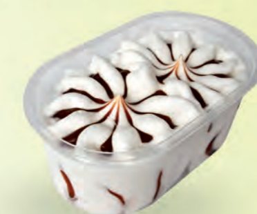
Nata con salsa de caramelo