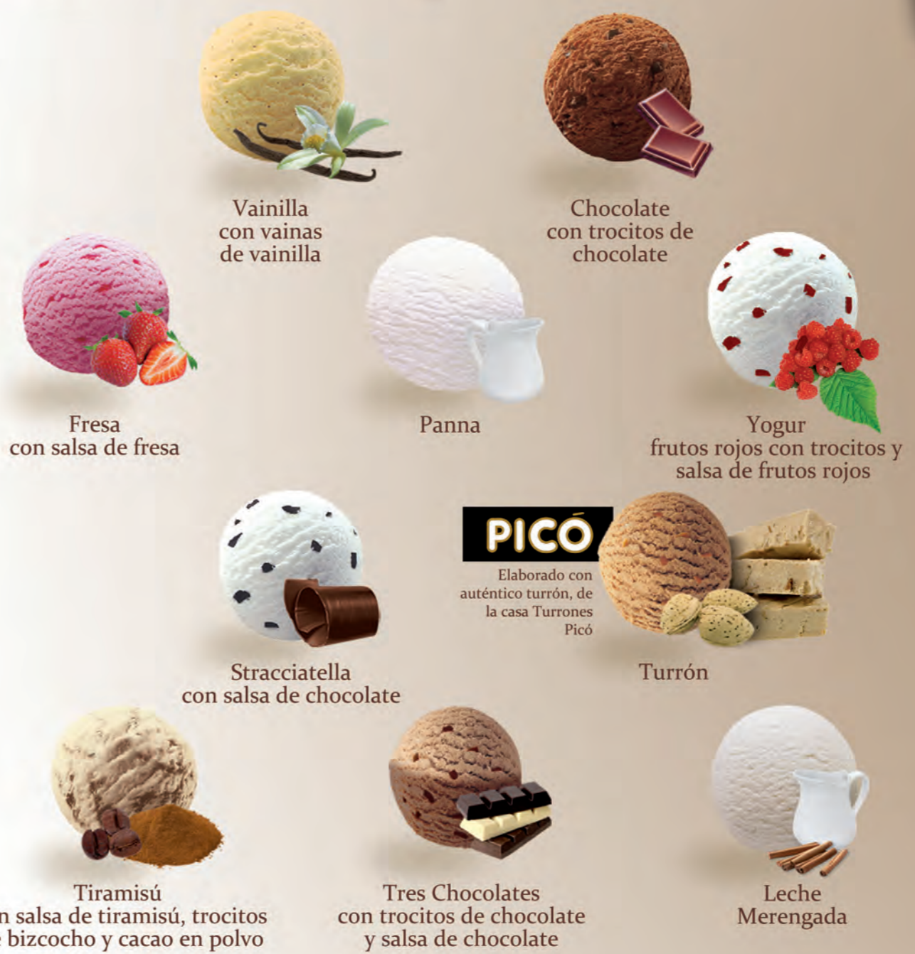
Fresa con salsa de fresa Vainilla con vainas de vainilla Chocolate con trocitos de chocolate Panna Yogur frutos rojos con trocitos y salsa de frutos rojos Stracciatella con salsa de chocolate Tiramisú con salsa de tiramisú, trocitos de bizcocho y cacao en polvo Tres Chocolates con trocitos de chocolate y salsa de chocolate Leche Merengada Turrón