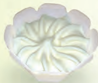
Sorbete de Limón