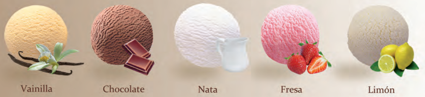
Vainilla Chocolate Nata Fresa Limón