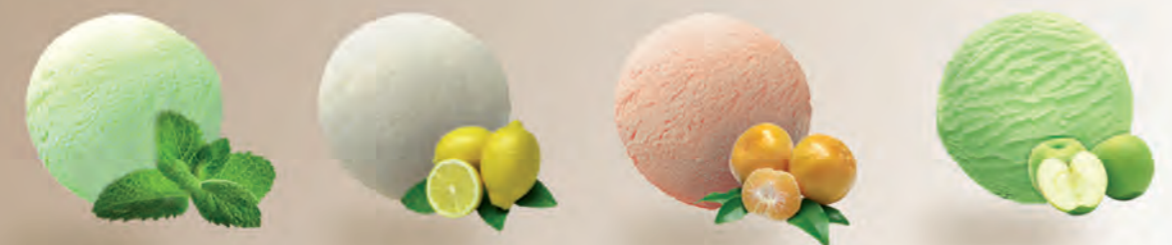
Mojito Limón Mandarina *2,3 L Manzana verde