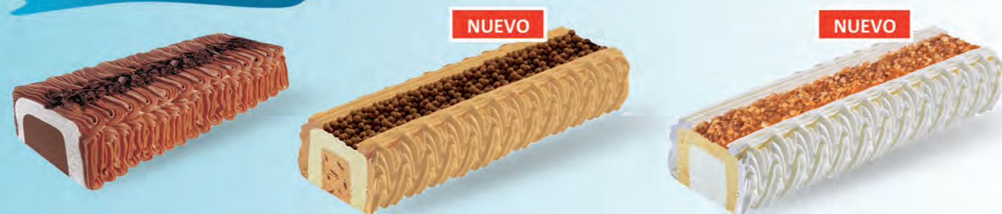
Nata - Chocolate