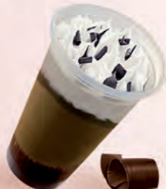
Nata · Chocolate