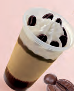
Nata · Café