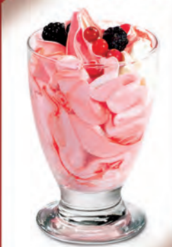
Helado de Nata y Fresa con Frutos del Bosque