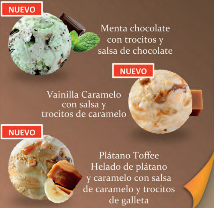
NUEVO Menta chocolate con trocitos y salsa de chocolate NUEVO Vainilla Caramelo con salsa y trocitos de caramelo NUEVO Plátano Toffee Helado de plátano y caramelo con salsa de caramelo y trocitos de galleta