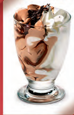
Helado de Nata y Chocolate