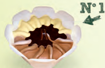
Vainilla · Chocolate