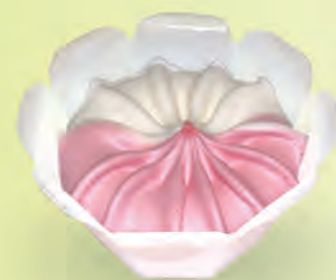
Nata · Fresa