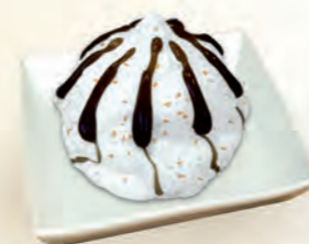
Nata · Nueces