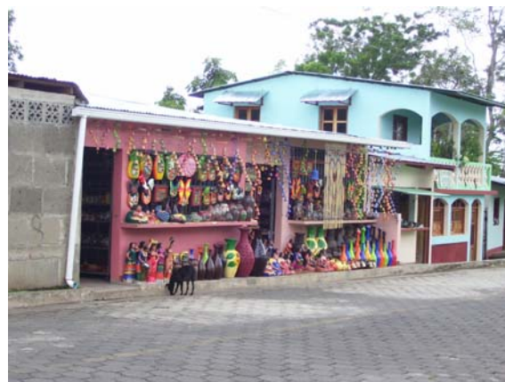
Puesto de Artesanías