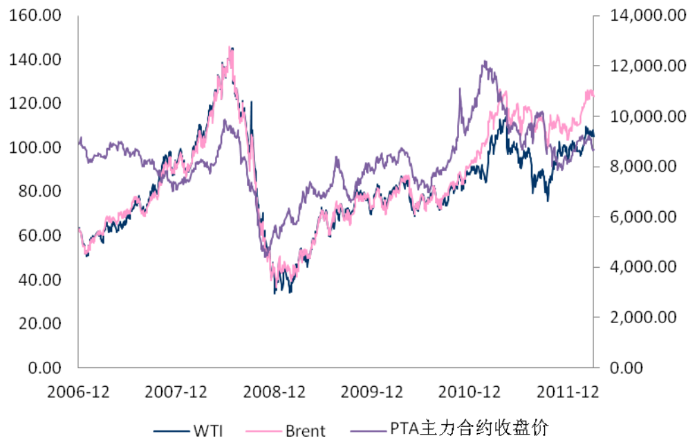
图3：国际原油价格走势

截止 2013 年 1 月 3 日的一周， 纽约商品交易所轻质低硫原油首月期货净涨 2.05 美元， 涨幅 2.26%； 每桶结算均价 92.17 美元， 比前一周高 2.385 美元， 结算价最高每桶 93.12 美元， 最低每桶 90.8 美元。 伦敦洲际交易所布伦特原油首月期货净涨 1.34 美元， 涨幅 1.21%； 每桶结算均价 111.59 美元， 比前一周高 1.68 美元， 结算价最高每桶 112.47 美元， 最低每桶 110.62 美元。