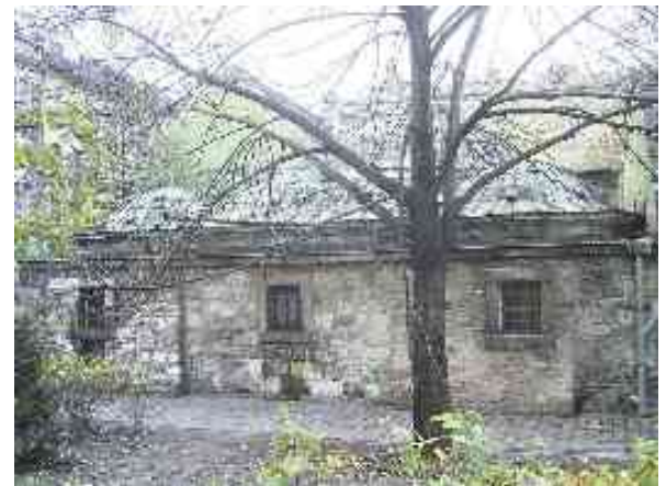
Abbildung 14 - Das über 400 Jahre alte Kiralybad