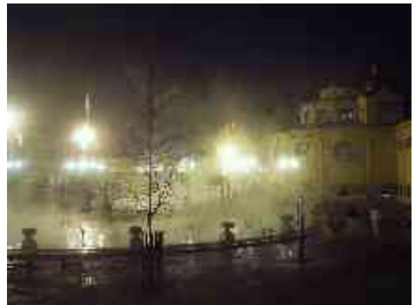
Abbildung 12 - Die Aussenbecken des Széchenyi im Herbst