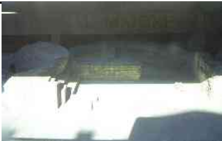
Abbildung 6 - Freigelegte Grundmauern eines Thermalbads in Aquincum (unter einer Autobahnbrücke)

Budapest ist nicht nur das einzige Kurbad, das zugleich Hauptstadt ist, sondern auch die größte Kurstadt Europas. Aus über 120 heißen Quellen stehen täglich über 30.000 Kubikmeter mineralstoffreiches Wasser in 21 Bädern zur Verfügung, von denen 10 Heilbäder sind. Viele dieser Bäder sind zugleich Bauten von beträchtlichem historischen wie architektonischen Rang.