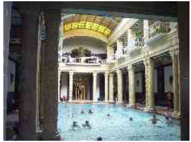
Abbildung 10 - Innenbecken des Gellert