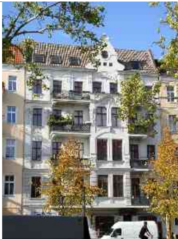
Abbildung 23 - Warschauer Straße 26