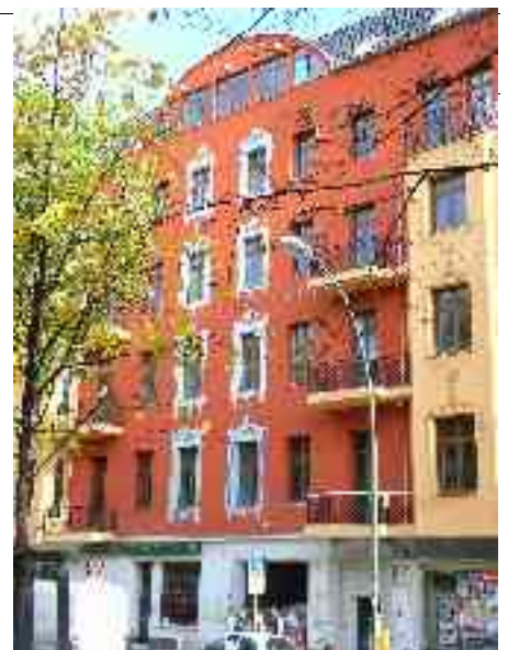
Abbildung 16 - Renoviertes Haus

Mit etwa 50 Metern Breite zählte die Warschauer Straße bereits zu Beginn des 20. Jahrhunderts zu einer der wichtigen Verkehrsstraßen und zu einer der Hauptversorgungsachsen des 1920 gegründeten Bezirks Friedrichshain. Die Straße war sehr früh bereits von Läden, Restaurants und Kneipen gesäumt und stellte so auch eine wichtige soziale Ader des Bezirks dar. Hierzu gehörte auch das 1902 gegründete Lichtspielhaus Elektra in der Warschauer Straße 26, die heutige Deponie .