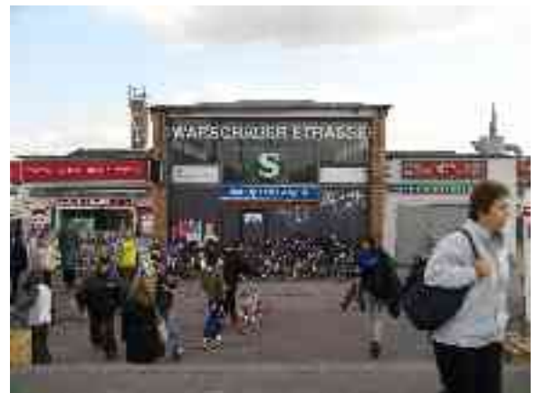
Abbildung 17 - S-Bahnhof Warschauer Straße

Von der ursprünglichen Bahnanlage sind heute noch das 1895 in Betrieb genommene mechanische sowie das aus den 1920er Jahren stammende elektrische Stellwerk B9 der Deutschen Reichsbahn vorhanden, beide stehen unter Denkmalschutz. Am südwestlichen Ende der Brücke steht außerdem das 1910 gebaute Empfangsgebäude des ehemaligen Schlesischen Güterbahnhofs sowie das 1900 errichtete, einstöckige Dienstgebäude.