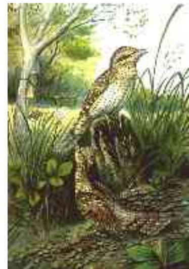
Abbildung 5 - Wendehals ( Jynx torquilla )

Das Überwinterungsgebiet der europäischen Arten liegt südlich der Sahara und zwar in einem breiten Streifen von Senegal, Gambia und Sierra Leone im Westen bis nach Äthiopien im Osten; nach Süden reicht es bis zum Staatsgebiet der Demokratischen Republik Kongo und Kameruns.