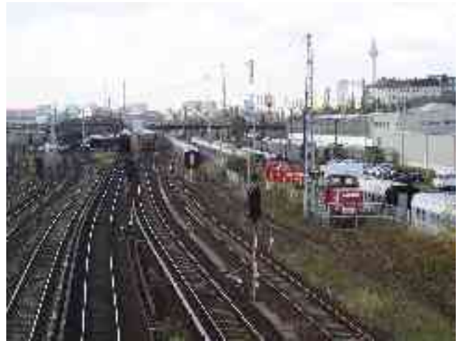
Abbildung 19 - RAW und S-Bahnhof (von der Modersohnbrücke)

Die Reichsbahnausbesserungswerkstatt im Bereich der Warschauer Straße ist der älteste Betrieb in Friedrichshain. Die Hauptgebäude dieser Werkstatt liegen dabei an der Revaler Straße, lediglich die westliche Begrenzung des Grundstücks reicht an die Warschauer Straße. Gegründet wurde der Betrieb am 1. Oktober 1867 als „Königlich-Preußische Eisenbahnhauptwerkstatt Berlin II“. Die Werkstatt gehörte zur Preußischen Ostbahn, die damals bis nach Königsberg/Ostpreußen und an die russische Grenze führte und deren Berliner Endpunkt der alte Ostbahnhof oder auch Küstriner Bahnhof (entspricht nicht dem heute existierenden Berliner Ostbahnhof) war, der ebenfalls im Jahr 1867 am Küstriner Platz , dem heutigen Franz-Mehring-Platz eröffnet wurde. Der Betrieb diente der Wartung und Instandsetzung von Lokomotiven sowie Waggons zum Transport von Personen und Gütern. Die Anzahl der hier angestellten Arbeiter erreichte bereits nach wenigen Jahren 600 Personen und der Betrieb wurde entsprechend ausgebaut. Ein weiterer Ausbau erfolgte 1882 nach Eröffnung der Stadtbahn Berlin, die Beschäftigtenzahl stieg auf 1.200 Angestellte. 1918 wurde der Betrieb zum „Reichsbahnausbesserungswerk“ (RAW).