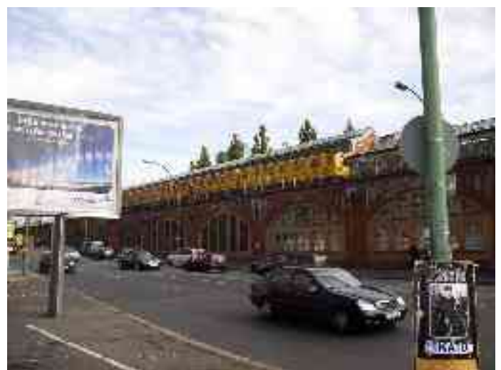
Abbildung 18 - Hochbahnstation Warschauer Straße

An der östlichen Brückenseite befindet sich die S-Bahn-Station Warschauer Straße. An dieser Stelle stand bereits von 1884 bis 1903 das erste Bahnhofsgebäude, welches von 1903 bis 1924 von einem Gebäude an der gegenüberliegenden Seite abgelöst wurde. 1924 wurde am ursprünglichen Standort ein neues Empfangsgebäude aufgebaut, konstruiert von Richard Brademann. Mit der Zerstörung der Brücke 1945 wurde auch dieses Gebäude zerstört; 1951 wurde stattdessen ein vereinfachter Bau an diese Stelle gebaut. Dieser macht bis heute einen sehr provisorischen und trostlosen Eindruck, die Eingangshalle ist seit einiger Zeit gesperrt. Anfang 2005 beginnt der Abriss des Bahnhofsgebäudes und der Zugänge. Ein Neubau soll jedoch erst zwischen 2007 und 2010 entstehen, da das Planfeststellungsverfahren dafür zur Zeit noch nicht abgeschlossen ist.