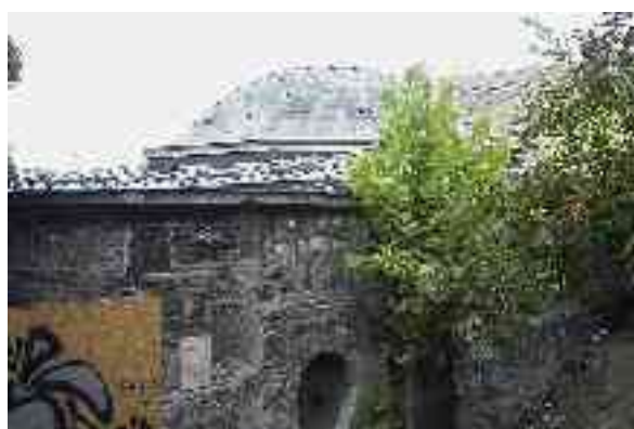
Abbildung 8- Der über 400 Jahre alte Kuppelbau des Rudasbads