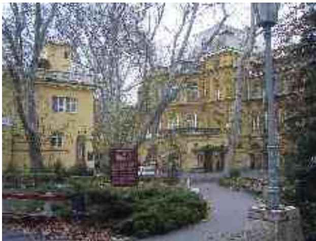
Abbildung 11 - Das Lukacs-Bad