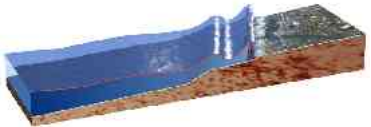
Abbildung 3 - Durch den an der Küste ansteigenden Meeresboden entsteht dort die hohe Amplitude

In Küstennähe wird das Wasser flach. Das hat zur Folge, dass Wellenlänge und Phasengeschwindigkeit abnehmen (proportional zu h^{1/2} ), die Amplitude der Welle und die Geschwindigkeit der beteiligten Materie aber zunehmen (proportional zu h^{-1/4} respektive h^{-3/4} ). Die Energie der Tsunamiwelle wird dadurch immer stärker konzentriert, bis sie mit voller Wucht auf die Küste auftrifft. Der Energiegehalt eines Wellenzuges ergibt sich als Querschnitt mal Wellenlänge mal Teilchengeschwindigkeit-zum-Quadrat und ist in erster Näherung unabhängig von h .