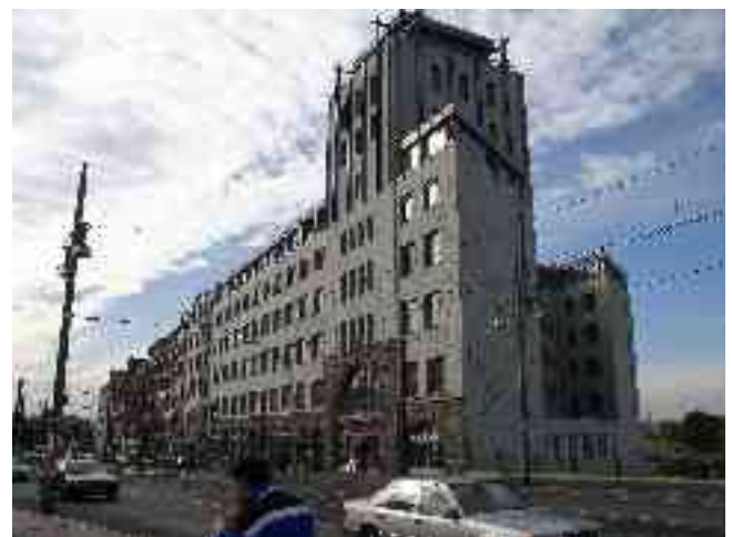
Abbildung 20 - Industriepalast an der Warschauer Straße

Bei dem Industriepalast handelt es sich um eine für ihre Zeit typische Etagenfabrik, die als Eisenskelettbau fünf einzelne Gebäude zu einem Gesamtkomplex verbindet. Durch den Einbau variabel nutzbarer Hallen und Lager, Krananlagen und einem unterirdischen Bahnanschluss sowie zwei Kellergeschosse wurden optimale Bedingungen für die Unterbringung von Gerbereien, holzverarbeitenden Firmen sowie elektrotechnischen Betrieben geschaffen. Die Ladenlokale an der Straße wurden von verschiedenen Geschäften und Gaststätten sowie einem Kino angemietet.