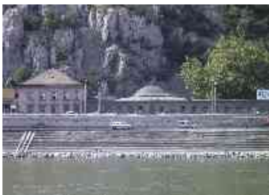
Abbildung 7 - Rudasbad an der Donau, rechts der türkische Kuppelbau