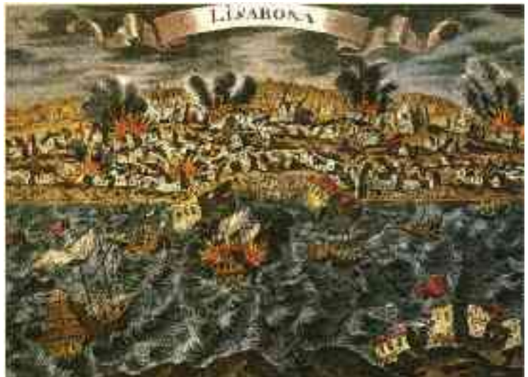
Abbildung 4 - Lissabon 1755

Um die Tsunami-Schäden einzuschränken, wurden überall auf der Erde Seismographen unter Wasser installiert, bisher jedoch kaum im Indischen Ozean. Eine wichtige Rolle bei der Auswertung der Daten spielt das Pacific Tsunami Warning Center PTWC in Honolulu auf Hawaii, das zwischen 1950 und 1965 schrittweise aufgebaut wurde. Fehlalarme können allerdings bei einer unnötigen Evakuierung hohe Kosten verursachen und das Vertrauen der Menschen in die Prognosen untergraben.