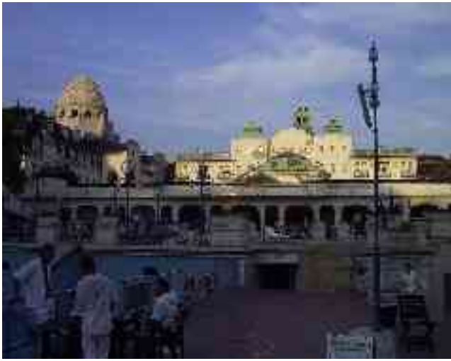
Abbildung 9 - Außenanlage des Gellert