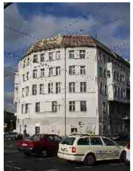
Abbildung 22 - Eckhaus

Der Bau für das Eckhaus wurde im Jahr 1906 begonnen und musste im Winter 1906/07 witterungsbedingt gestoppt werden. Nach einem Gutachten durch das „Königliche Materialprüfungsamt der Technischen Hochschule Berlin“, welches eine unbeschädigte „Überwinterung“ bestätigte, konnte es 1908 fertiggestellt werden.