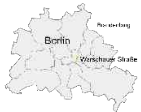
Abbildung 15 - Karte von Berlin mit eingekreizter Warschauer Straße

Ihren Namen erhielt die Warschauer Straße mit ihrem Ausbau am 23. Februar 1874, davor wurde sie einfach als Straße Nr. 11 in der Abteilung XIV des Bebauungsplanes von den Umgebungen Berlins bezeichnet und stellte einen einfachen Verkehrs- und Transportweg dar. Bereits auf dem Hobrechtplan von 1864 war die Straße als Hauptverkehrsader geplant und sollte einen Teil eines Ringsystems nach Pariser Vorbild um die damaligen Städte Berlin und Charlottenburg bilden.