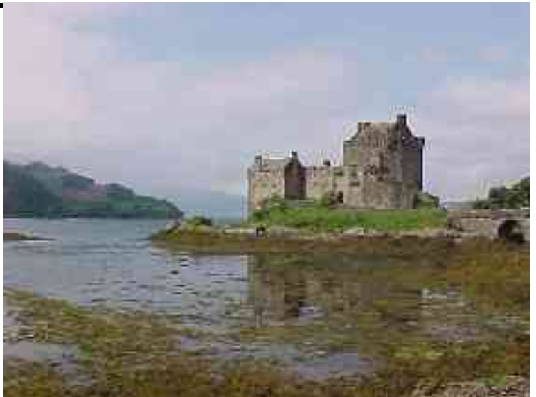
Abbildung 1 - Die Burg im Loch Duich

Die Burg wurde 1220 von Alexander II. von Schottland erbaut, und es wird erzählt, dass sie eine der Fluchtburgen von Robert the Bruce gewesen war, als er vor den Engländern flüchtete. Sie wurde von drei Englischen Fregatten im Jahre 1719 zerstört, als sie als Garnison von spanischen Truppen genutzt wurde. Wiederverrichtet wurde sie 1932.