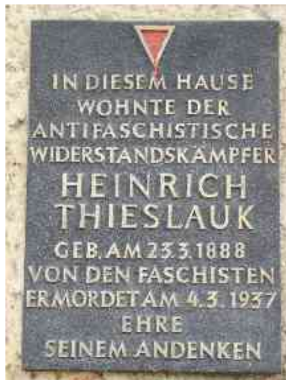
Abbildung 24 - Gedenktafel für Heinrich Thieslauk