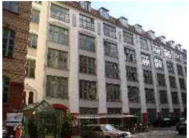
Abbildung 21 - Ehemalige Werkshalle des Propellerwerkes

Das älteste deutsche Propellerwerk hatte seinen Sitz im zweiten Hinterhof der Warschauer Straße 58. Es wurde gegründet von dem Möbeltischler Hugo Heine. Dieser begann im Jahre 1910 in Waidmannslust mit der Fertigung von Holzpropellern für Flugzeuge, nachdem er bei einem Schauflug auf dem Flugplatz Johannistal durch Zufall den Auftrag erhielt, einen zerbrochenen Propeller zu reparieren. In seiner Tischlerei baute er die Idee weiter aus und konnte bis 1914, dem Jahr, in dem er seine Meisterprüfung ablegte, fünf Mitarbeiter beschäftigen. Bedingt durch die Nachfrage im 1. Weltkrieg baute Heine seine Tischlerei zu einer Fabrik aus, die bis 1918 300 Arbeitskräfte beschäftigte. Nach Kriegsende stellte er die Produktion wieder auf Möbel um, da der Flugzeugbau in Deutschland durch die Siegermächte verboten wurde, und musste einen Großteil der Arbeiter entlassen. Im Jahr 1921 konnte er die Produktionsstätte in der Warschauer Straße erwerben und baute hier eine Tischlerei für Schlafzimmereinrichtungen auf.