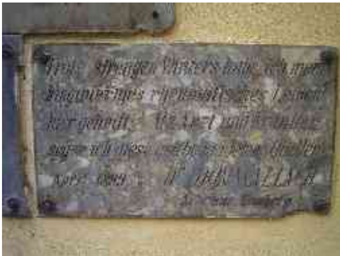
Abbildung 13 - Votivtafel am Lukacs-Bad