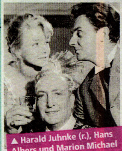
▲ Harald Juhnke (r.), Hans Albers und Marion Michael in „Der tolle Bomberg“