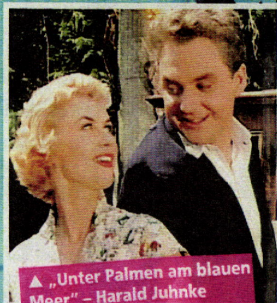
▲ „Unter Palmen am blauen Meer“ – Harald Juhnke drehte 1957 mit Bibi Johns