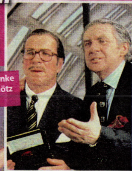
Heute ein Klassiker: Juhnke 1991 an der Seite von Götz George in „Schnok!“ ▶