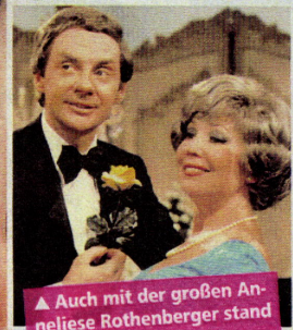
▲ Auch mit der großen Anneliese Rothenberger stand Juhnke vor der Kamera