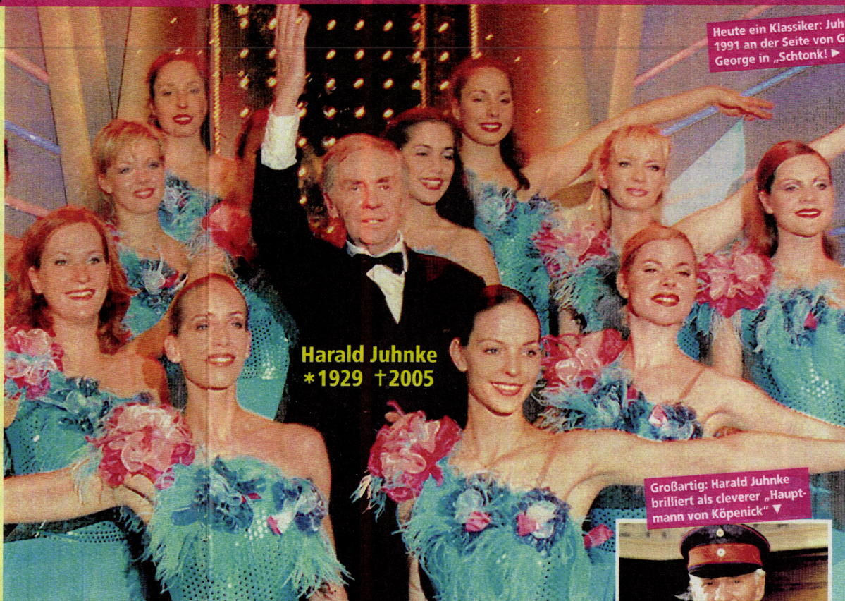
Harald Juhnke *1929 †2005