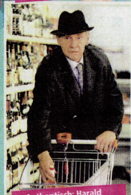
▲ Authentisch: Harald Juhnke spielt 1995 die Hauptrolle in „Der Trinker“