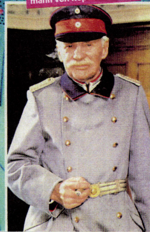
Großartig: Harald Juhnke brilliert als cleverer „Hauptmann von Köpenick“ ▼