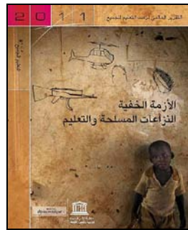
الأزمة الخفية النزاعات المسلحة والتعليم