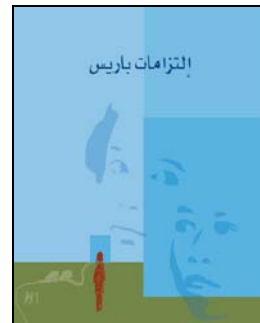
التزامات باريس لحماية الأطفال من التجنيد غير المشروع أو استغلالهم