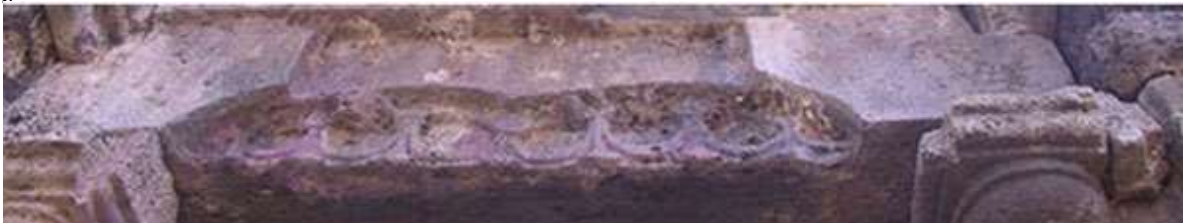
ផ្តែរអាស្រមមហាឥសី (ថត ១៩៩៣)

នេះជាលើកដំបូងហើយ ដែលយើងបានជួបនូវផ្តែរ ដែលមានរាងជាអង្កត់ពីកំណាត់ ដែលមានក្បាច់ផ្តារ យោលតាមលំនាំឥណ្ឌា ។ ម្យ៉ាងវិញទៀត ស្ថិតនៅលើក្លោងទ្វារចូល ផ្តែរនេះបញ្ចេញមុខងារមួយយ៉ាងសំខាន់ គឺការស្វាគមន៍ដល់សាសនិកជន ដោយផ្តល់នូវភាពរីករាយ សប្បាយ តាមរយៈកម្រងផ្កាដែលស្ថិតលើក្បាល របស់ខ្លួន ។