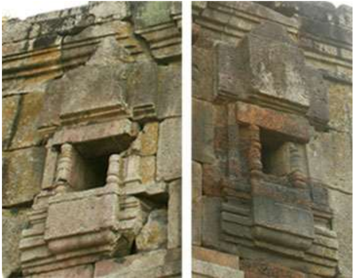
វិមានអាកាស (ថត ២០០៦)