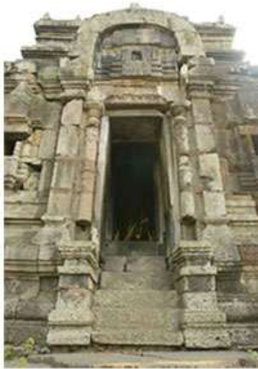
ទិដ្ឋភាពរួមនៃប្រាសាទអាស្រមមហាឥសី, ខេត្តតាកែវ (ថត ១៩៩៣-២០០៦)