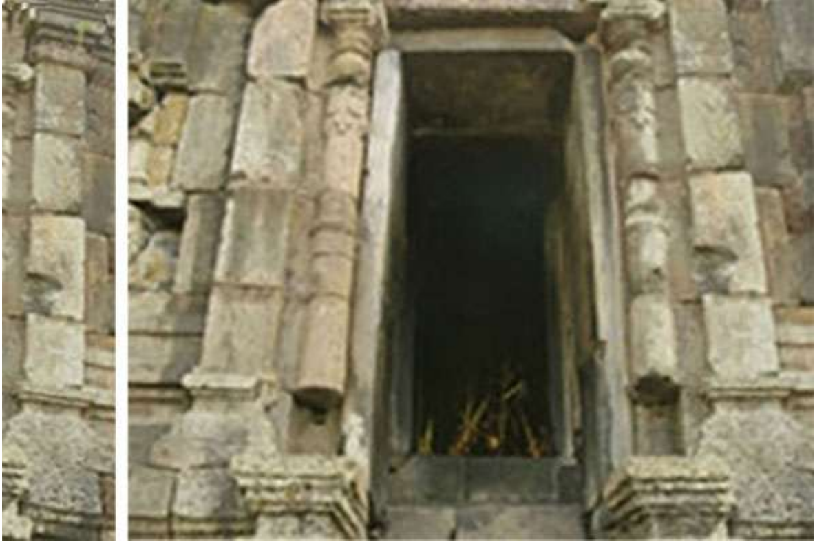
សសររដ្ឋាប (ថត ២០០៦)