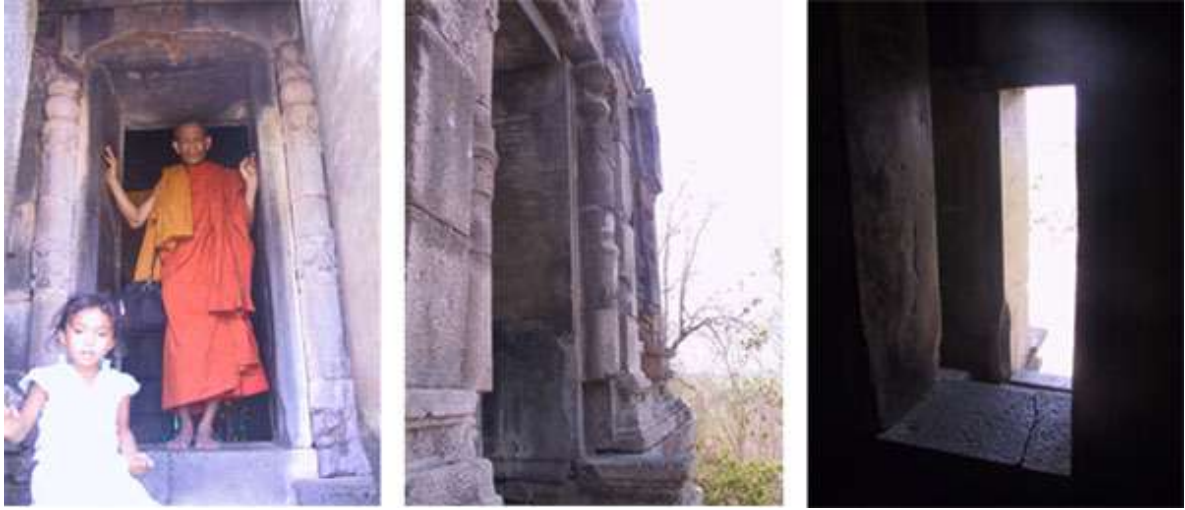
ទ្វារចូល-មើលពីក្រៅនិងមើលពីក្នុងចេញក្រៅ (ថត ២០០៦)