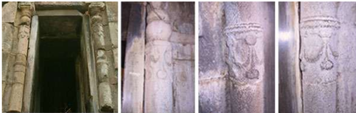
សសរពេជ្រ ផ្នែកខាងក្រៅ និងខាងក្នុង (ថត ២០០៦)

ជាការពិតណាស់ ដែលតួនាទីចម្បងរបស់សសរពេជ្រ គឺការទ្រទ្រង់ចម្លាក់ផ្តែរដ៏ធ្ងន់ ក៏ប៉ុន្តែលើសពីនេះ ទៀត ក៏មានតួនាទីលំអសោភ័ណភាពប្រាសាទដែរ ។ ទោះជាទីនេះ សសរពេជ្រ ដែលគេដាក់បញ្ឈរនៅអមសងខាងទ្វារចូល ហើយទ្រទ្រង់ផ្តែរនោះ លំអរដោយក្បាច់លំអដ្ឋារំយោល តែនៅផ្នែកកណ្តាលក៏មានការឆ្លាក់ក្បាច់ចិញ្ចៀនដែរ ។