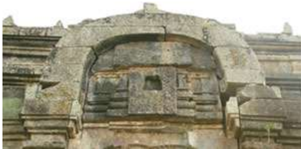
ហោជាង (ថត ២០០៦)