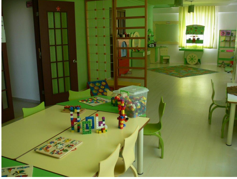
Görsel:Sınıf Genel Görünüş