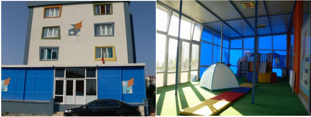
Görsel:Çorlu Küçük Şeyler Akademisi Binası Görsel:Kapalı Oyun Alanı

Çocukların bu eğitimi doğru alabilmeleri için doğru fonksiyonlarla birlikte doğru formlar ve renklerle mekanlarını şekillendirmişlerdir.