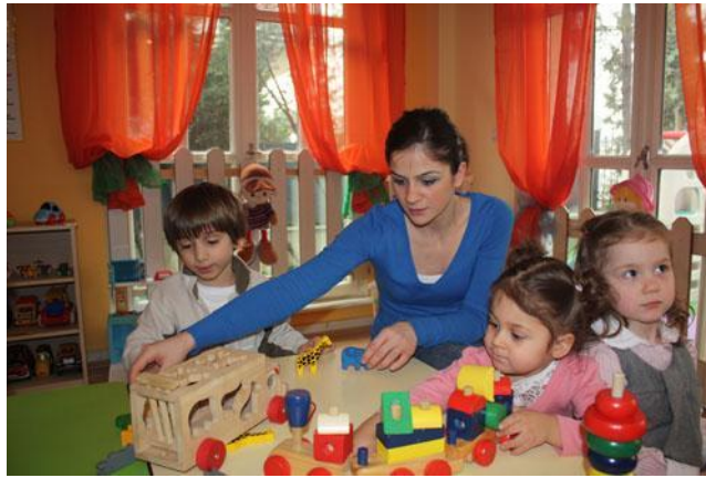
Görsel1: Küçük Melekler Anaokulu 3 yaş grubu

Benlikleri gelişmeye başlar. Kız çocukları genelde anneye özenirler ve kendilerini babalarına begendirme arzusu içerisindedirler. Erkek çocukları ise babaya benzemeye çalışırlar. Çocuklar bu yaşlarda isimlerini soysisimlerini ve yaşlarını söyleyebilirler. Bazen şiir, mani, şarkı sözü ezberleyebilirler. Ana renkleri iyi bilirler. Resim çizmeye ve boyamaya çok meraklıdırlar. Sevdikleri hikayeleri tekrar dinlemekten hoşlanırlar ve kendileri de tekrar etmeye çalışırlar.