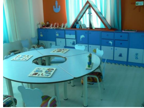
Görsel:Grup Çalışma Alanı