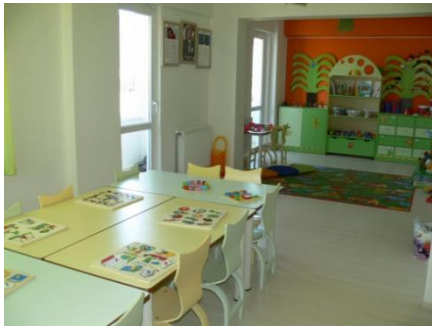
Görsel:Sınıf Çalışma Alanı