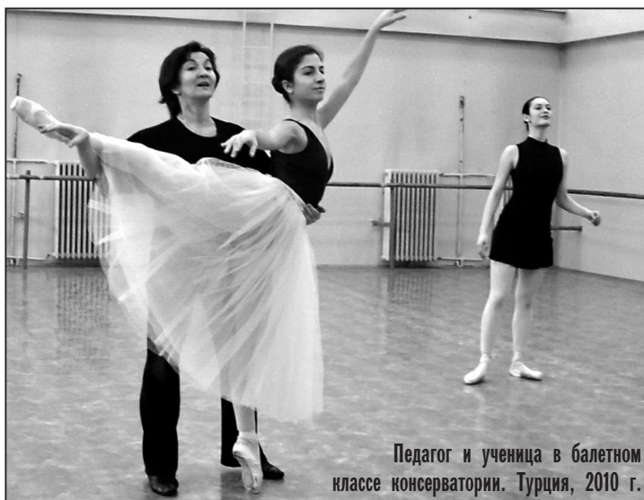
Педагог и ученица в балетном классе консерватории. Турция, 2010 г.

- Иногда кто-то из них ко мне подходит, чтобы сообщить: а вы, оказывается, известная балерина, мы про вас читали в Интернете. Я отвечаю, мол, да, по крайней мере, была не из последних, - и больше