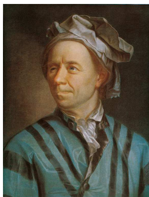
Leonhard Euler (1707-1783)

und konvergiert somit gegen 0. Also liegt insgesamt eine Intervallschachtelung vor. \square