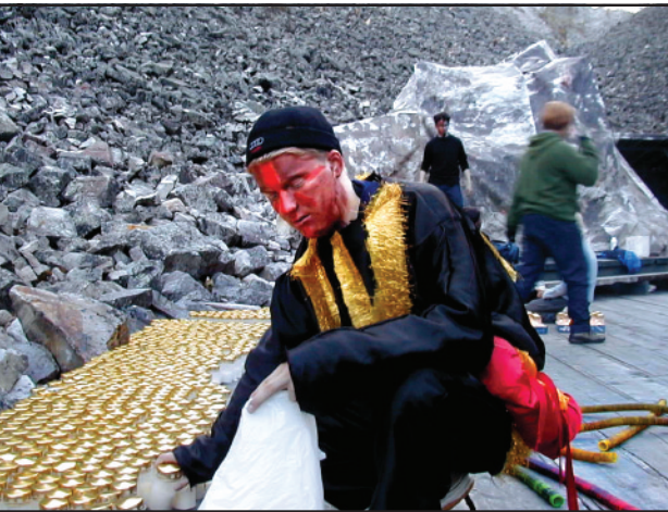
Innostajan tehtävänä on tuoda tietämystään vain täydentämään osallistujien omaa tietoa ja samalla häneltä edellytetään nöyrää asennetta ja rohkeutta myöntää oman tietonsa rajallisuus.

Osallistavan suunnittelun menetelmät tähtäävät pitkälti samoihin päämääriin kuin sosiokulttuurinen innostaminen, eli ihmisten valtaistamiseen (empowerment) ja heidän vaikutusmahdollisuuksiensa lisäämiseen. Ihmisten taito käyttää