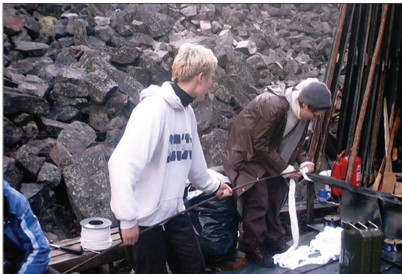
Sosiokulttuurisen toiminnan tavoitteena on aidon yhteisöllisyyden synnyttäminen.

Toimivassa yhteisössä on kyse herkkävireisestä tasapainosta yksilön ja yhteisön intressien välillä. Yksilön on tietyissä tilanteissa seisottava omien näkemyksiensä takana. Vaikka kaikki muut olisivat toista mieltä. Toisessa tilanteessa hänen on luovuttava omien etujensa tavoittelusta, varsinkin, jos ne ovat liian räikeässä ristiriidassa yhteisön muiden jäsenten tarpeisiin nähden. Vaaditaan jatkuvaa dialogia yhteisön jäsenten kesken, jotta voidaan tietää, milloin on syytä pitää päänsä, milloin taas antaa periksi. Pelkkä ristiriitojen välttäminen ei toimivassa yhteisössä koskaan saa olla syy periksi antamiselle.