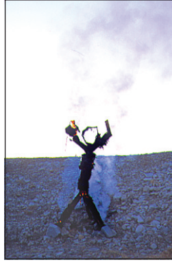
Materiaali kannattaa tapahtumaa varten muokata näyttelyyn sopivaksi. Tällöin pitää miettiä, miten kerätty materiaali toimii parhaiten näyttelyyn varatussa tilassa.