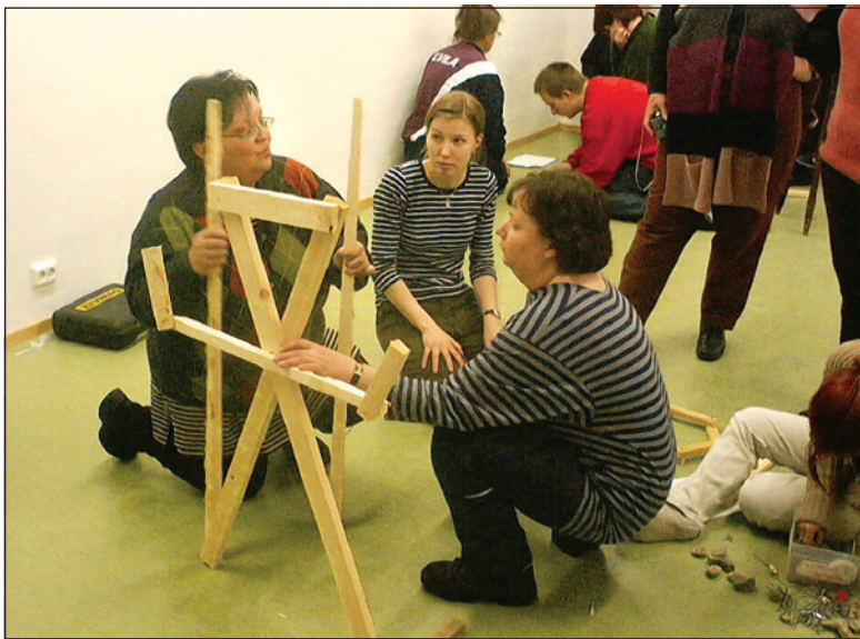
Yhteisöllinen taidekasvatuksen projektit ovat parhaimmillaan sosiokulttuurista innostamista.

Seuraava toimintamalli sopii esimerkiksi yhdistyksessä toimivan harraste- tai yleiskerhon, tai koululuokan toteutettavaksi.